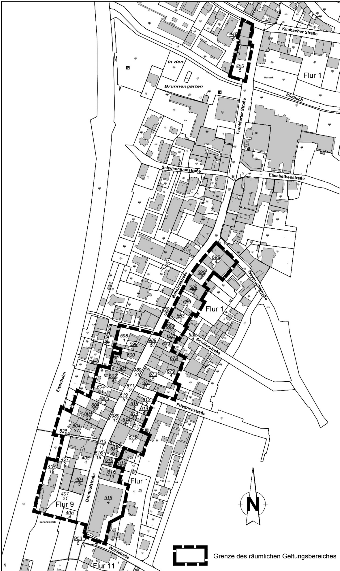
Datengrundlage: Amtliches Liegenschaftskatasterinformationssystem (ALKIS) der Hessischen Verwaltung für Bodenmanagement und Geoinformation