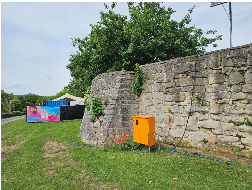
Abb. 3: Vorgesehene Sondergebietsfläche an der Stadtmauer