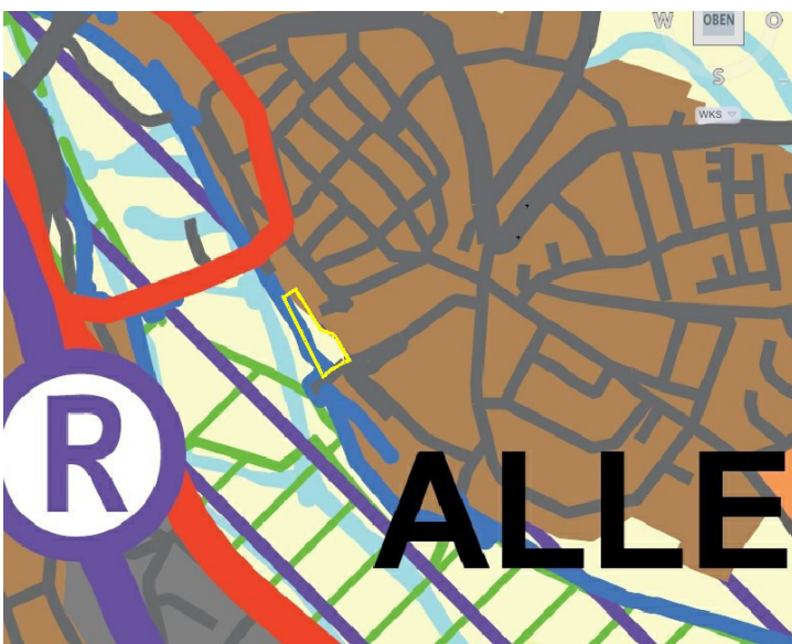
Abb. 5: Regionalplan Nordhessen 2009 (Geltungsbereich gelb)

Im Regionalplan Nordhessen 2009 (Abb. 5) ist der Geltungsbereich überwiegend als Vorbehaltsfläche Landwirtschaft , ein kleiner Teil im Norden als „ Vorranggebiet Siedlung Bestand “ ausgewiesen. Die Planung steht damit Zielen der Regionalplanung nicht entgegen.