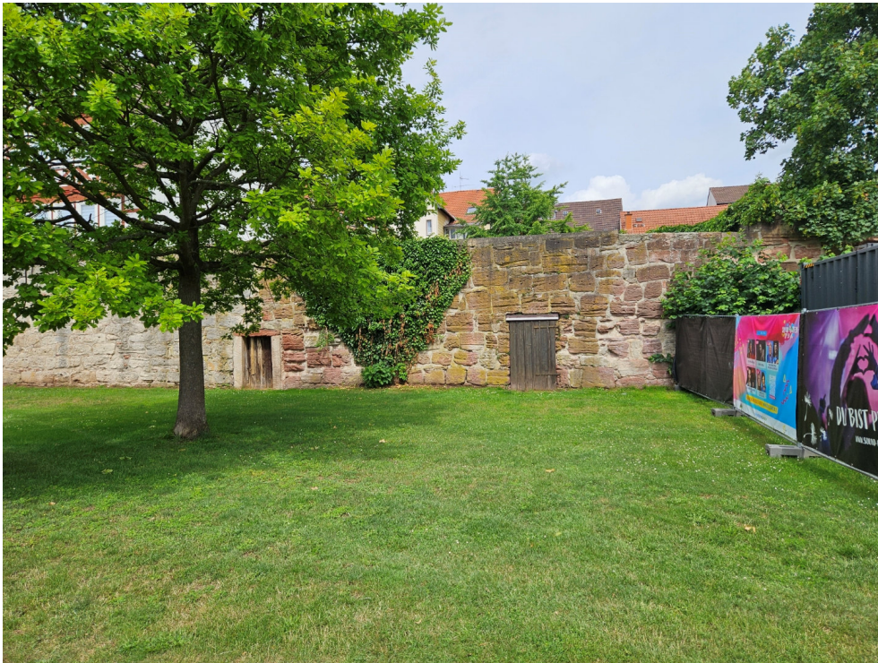
Abb. 2: Vorgesehene Sondergebietsfläche an der Stadtmauer