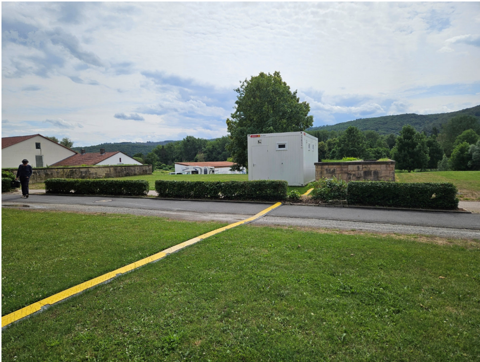
Abb. 4: Regenrückhaltefläche – vorgesehener Standort für temporäre Sanitärcontainer