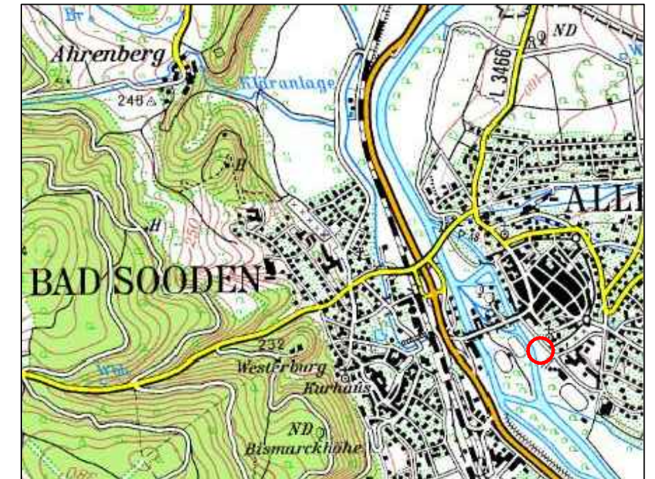
Übersichtslageplan (aus: TOP 50 Hess. Amt für Bodenmanagement o.M.)