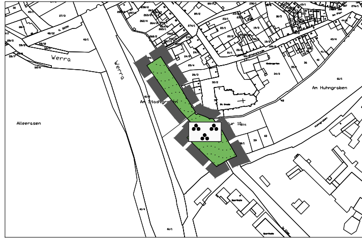
Flächennutzungsplan vor der 9. Änderung (M 1 : 5.000)