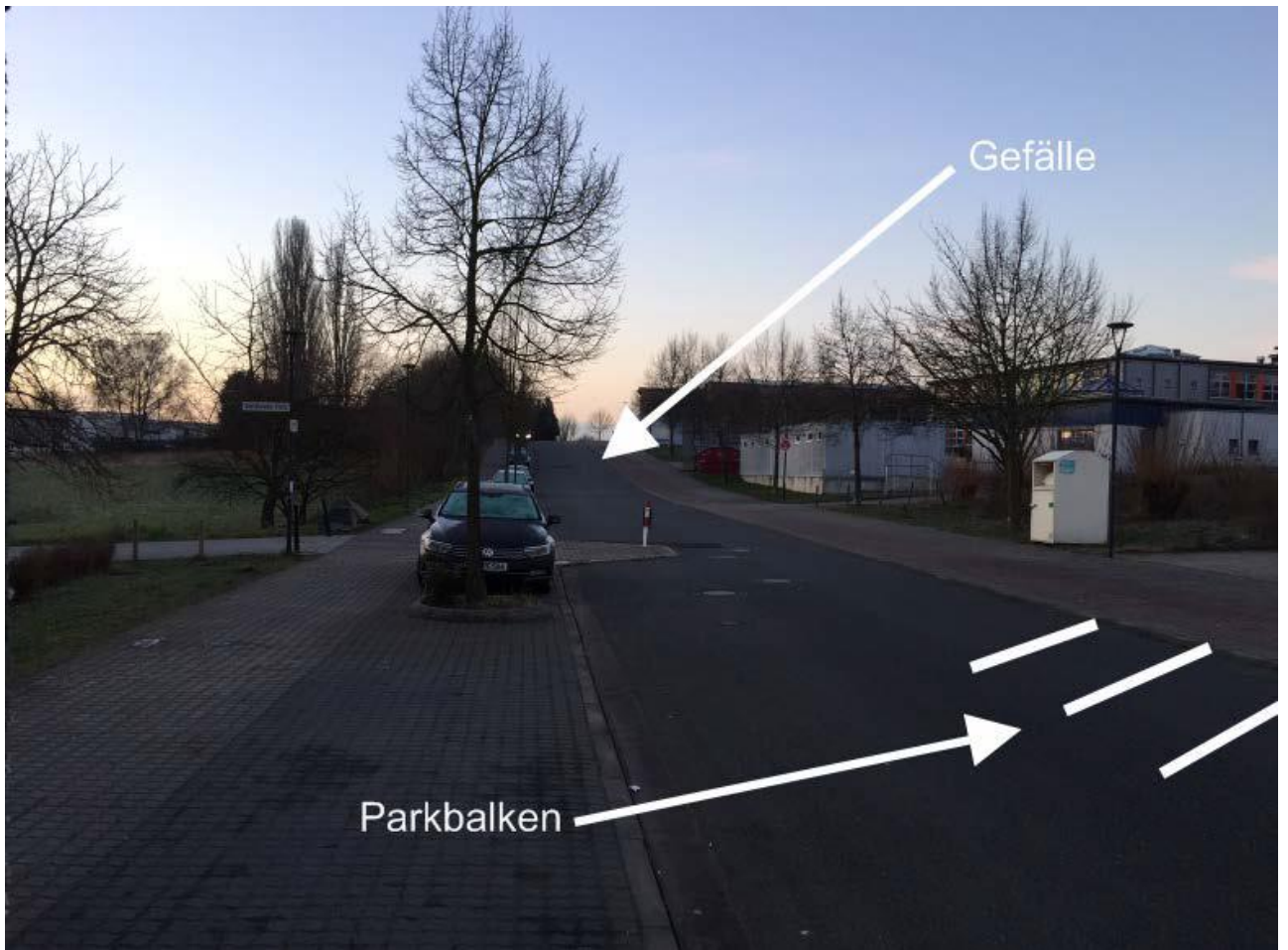
Willy-Brand-Straße Höhe Regenbogenschule: Gefällestrücke