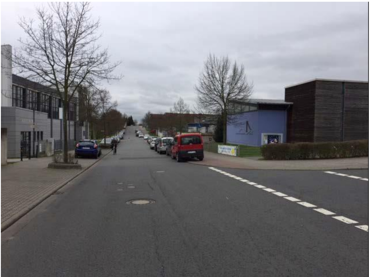
Willy-Brandt-Straße Ecke Johann-Strauß-Straße: verbotswidriges Parken auf dem Geh- und Radweg