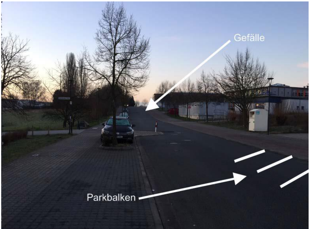
Willy-Brand-Straße Höhe Regenbogenschule: Gefällestrücke