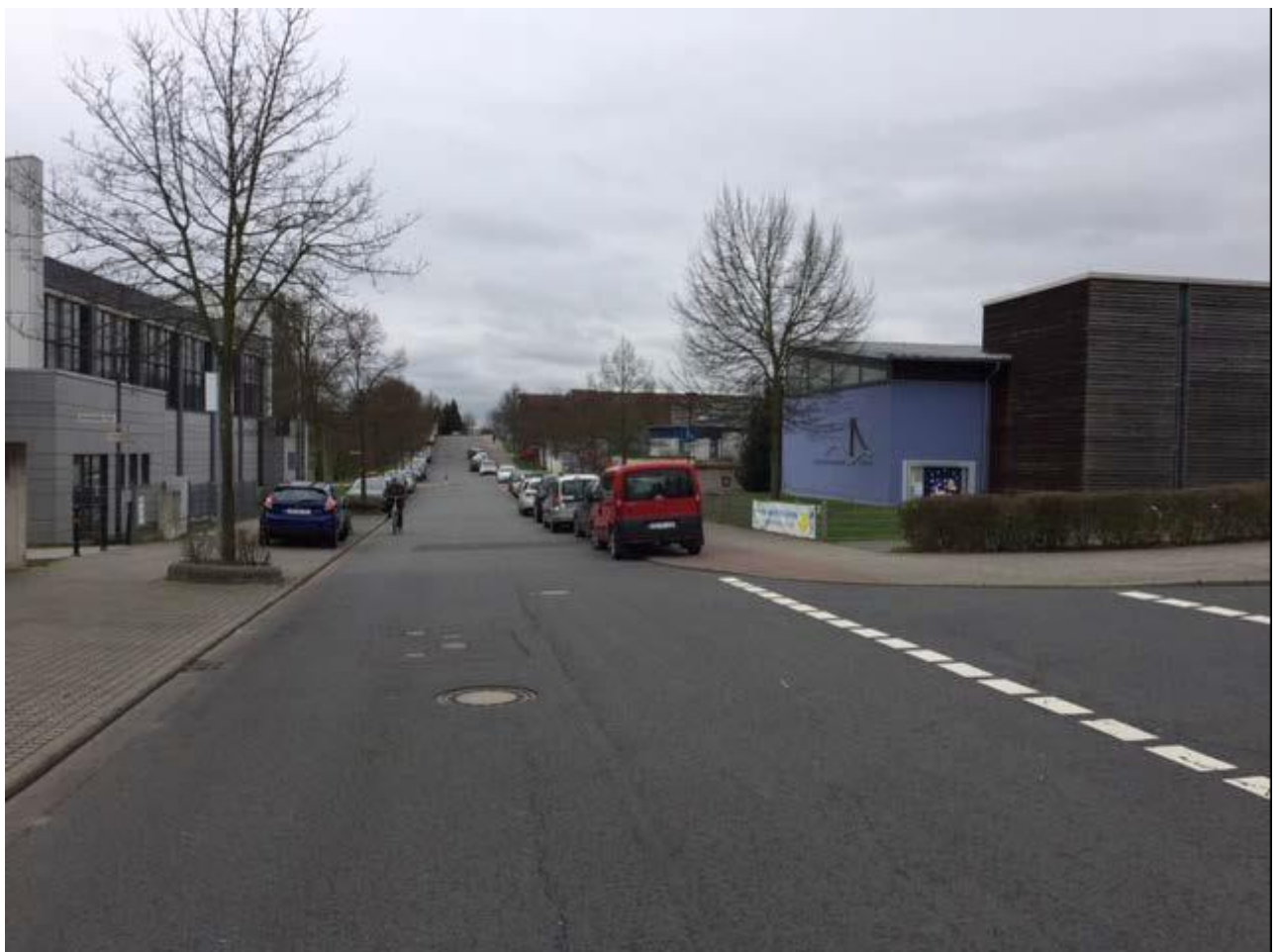
Willy-Brandt-Straße Ecke Johann-Strauß-Straße: verbotswidriges Parken auf dem Geh- und Radweg