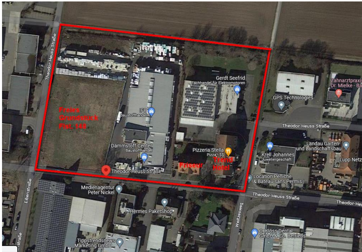
Abb. 2: Luftbild mit nachträglicher Eintragung der Nutzungen im Geltungsbereich

Die derzeitigen Nutzung innerhalb des Plangebietes werden nachfolgend beschrieben und sind in der folgenden Abb. 2 dargestellt.