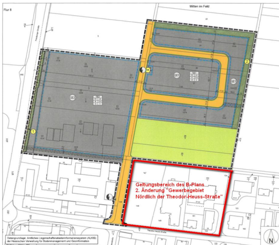
Abb. 3: Gewerbegebiet „Nördlich der Theodor-Heuss-Straße II“ (Quelle Gutachten GSA) mit nachträglicher Kennzeichnung des Geltungsbereich 2. Änderung des Bebauungsplans „Gewerbegebiet Nördlich der Theodor-Heuss-Straße“

Der Geltungsbereich des Bebauungsplans ist im Norden von einem wasserführenden Graben begrenzt, der das Gebiet von einem Wirtschaftsweg und derzeit noch landwirtschaftlich genutzten Flächen trennt. Die Stadtverordnetenversammlung der Stadt Bad Vilbel hat in diesem nördlich angrenzenden Bereich in ihrer Sitzung am 28.09.2021 die Aufstellung des Bebauungsplan für das Gewerbegebiet „Nördlich der Theodor-Heuss-Straße II“ mit einer Gesamtfläche von ca. 7 ha. beschlossen . Die schalltechnischen Belange für diesen B-Plan, der noch im Verfahren ist, wurden in der Geräuschimmissionsprognose P 22015 des Büros GSA Ziegelmeier GmbH vom 09.06.2022 untersucht, welche dem TÜV Hessen von der Stadt Bad Vilbel zur Verfügung gestellt wurde.