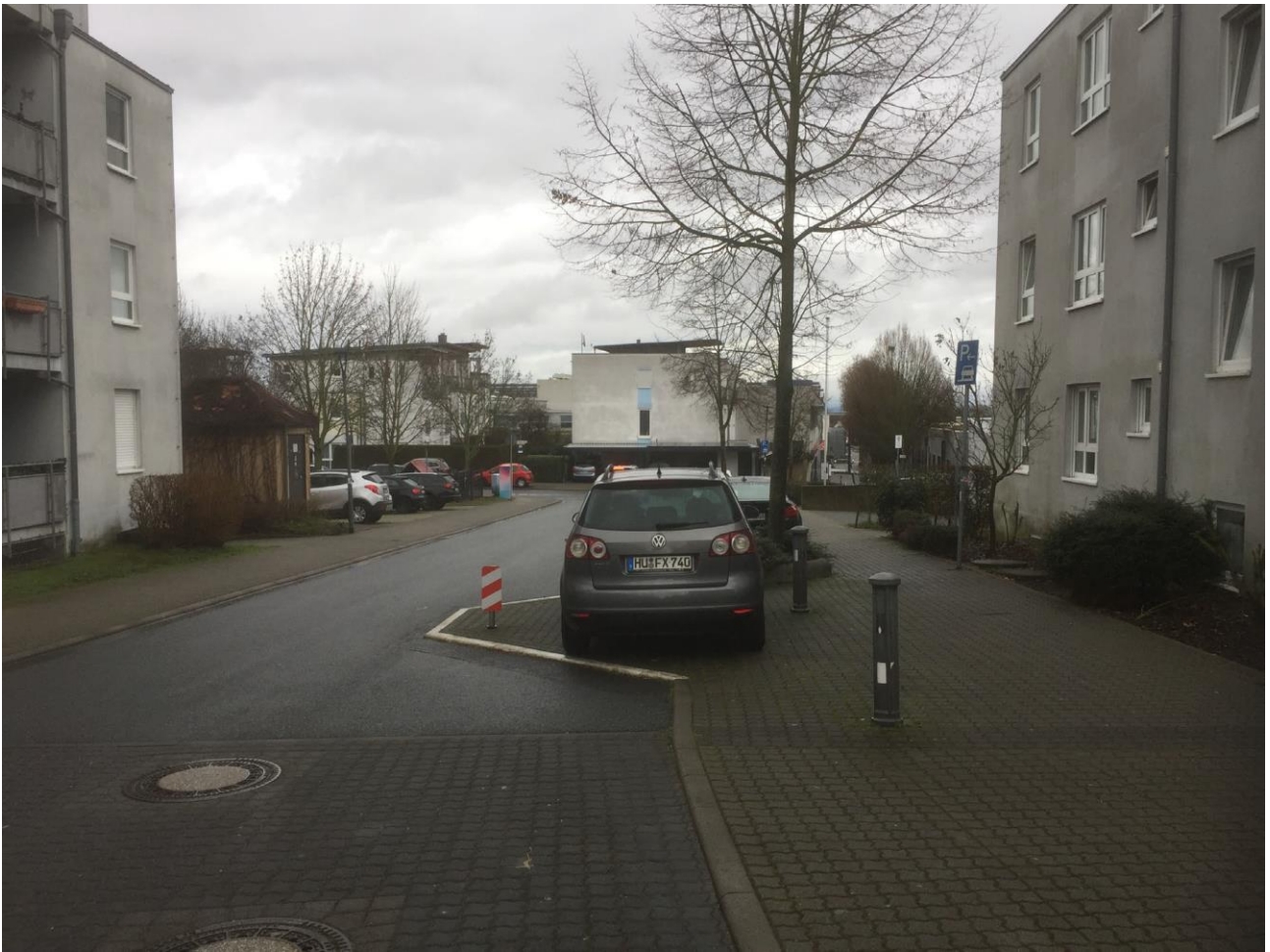
Fahrbahnverengung in der Johann-Strauß-Str.