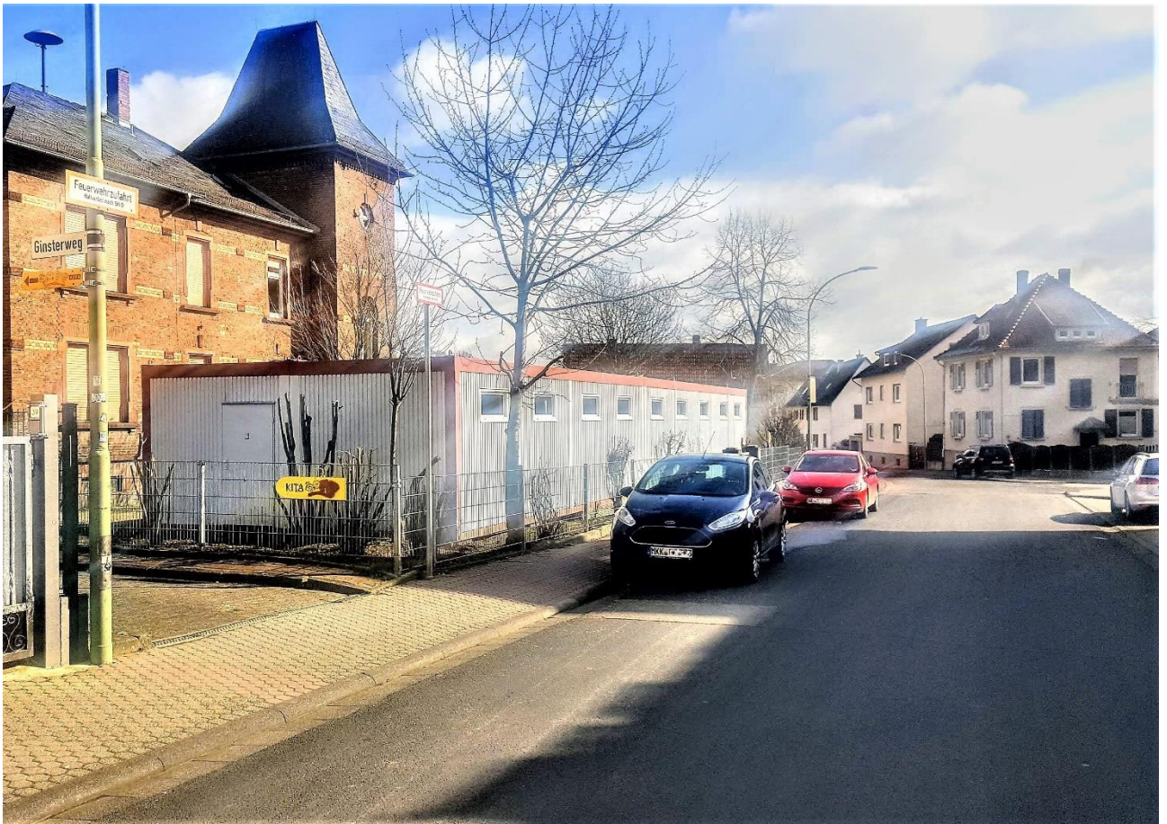
Bahnhofstraße mit Zugang Kita Rasselband und Regenbogenschule