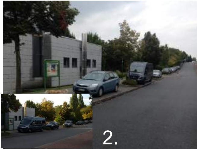
Willy Brandt Strasse