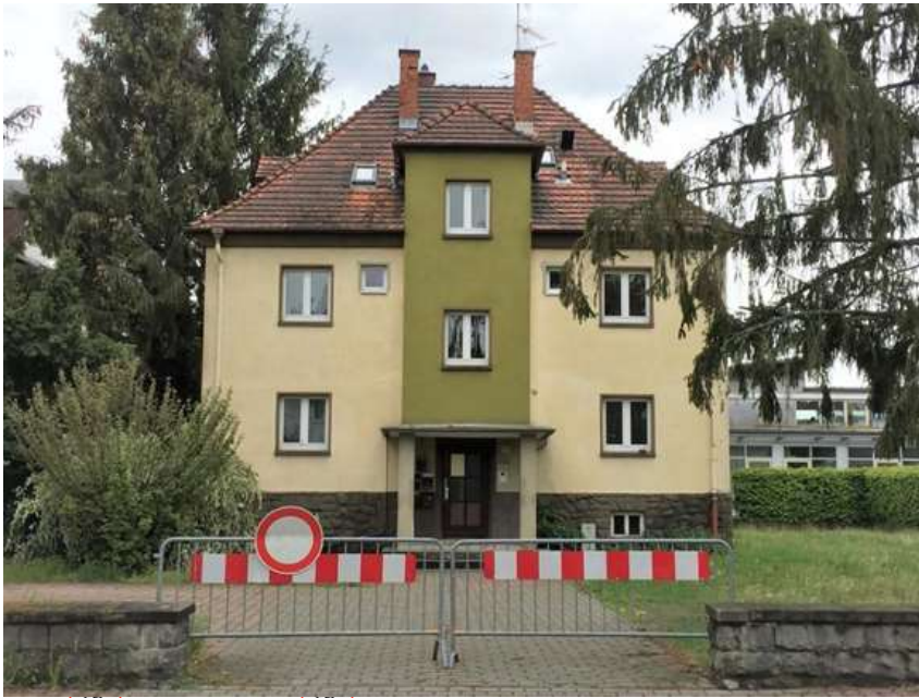
Villa Nr. 113 (2).pdf Villa Nr. 113 (2).pdf

Die Arbeiterwohlfahrt (AWO) Bruchköbel erkennt den dringenden Bedarf für ein weiteres Angebot für Betreutes Wohnen in Bruchköbel. Sie ist bereit, das hierfür erforderliche Betreuungsangebot in vollem Umfang zu leisten. Auch bei dem für die Finanzierung zuständigen AWO-Bezirksverband Hessen-Süd besteht Bereitschaft und Interesse, dieses Projekt zu verwirklichen. Der Standort Hauptstraße 113 ist für das Projekt eines Betreuten Wohnen ideal geeignet, weil die entsprechende Organisation und die Leistungen direkt vom benachbarten, bereits vorhandenen, Gebäudekomplex der AWO her erbracht werden können.