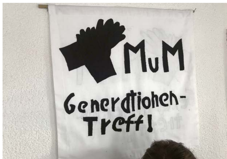
● Generationentreff Raboldshausen

Der demographische Wandel zeigt insbesondere Auswirkungen in den verschiedenen Bereichen der öffentlichen Daseinsvorsorge. Vor dem Hintergrund einer Sicherstellung gleichwertiger Lebensverhältnisse in den ländlichen Räumen sind die Entwicklungen der sozialen Infrastruktur und Daseinsvorsorge eine wesentliche Aufgabe von Politik und öffent-