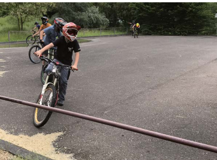
● Funpark Niederwalgern

Zur Erreichung dieses Programmziels ist eine Auseinandersetzung mit der städtebaulichen Entwicklung ein festes Modul und zentrales Handlungsfeld im IKEK. Grundlage der städtebaulichen Entwicklung ist die Erfassung des bau- und kulturgeschichtlichen Erbes sowie der Innenentwicklungspotentiale (Leerstände, Baulücken usw.) der Ortskerne. Darüber hinaus ist eine Überprüfung der aktuellen Planungen sowie der Zielrichtung der Siedlungsentwicklung erforderlich.