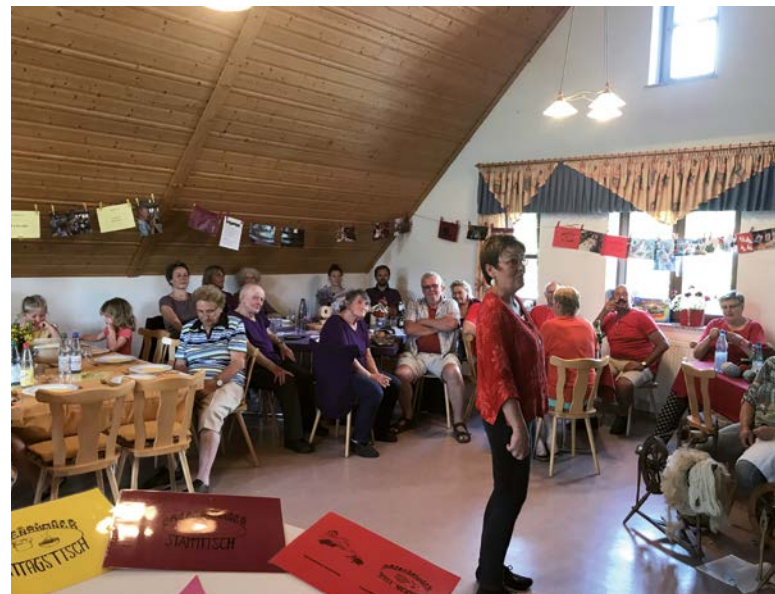
● Dorfgemeinschaft Poppenhausen

Die Bürgerinnen und Bürger sind auch im Rahmen des IKEK-Prozesses ehrenamtlich zu beteiligen. Es sollte darauf hingewirkt werden, dass diese Mitwirkung an strategischen Fragen nach der Erarbeitung des IKEK fortbesteht. Hierzu sind geeignete Strukturen anzustoßen. Schließlich sollte die Kommune zur Unterstützung eines flexiblen ehrenamtlichen Engagements bei der Kommunikation von Möglichkeiten ehrenamtlichen Engagements tätig werden.