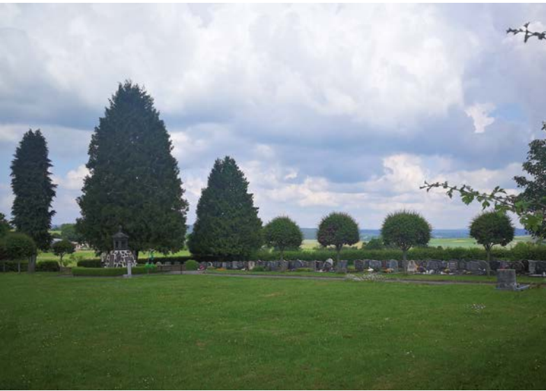
● Friedhof Fronhausen

finanzierbaren Maßnahmen im Rahmen der Dorfentwicklung begleitet werden, um das Schrumpfen zu organisieren und die Situation in den ländlichen Räumen insgesamt zu stabilisieren.