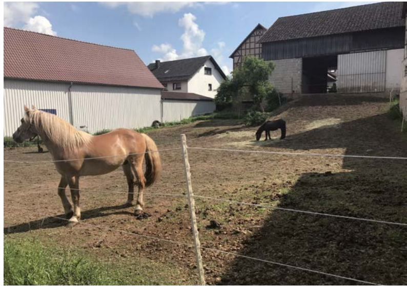
● Pferdeweide Frohnhausen

Um einer dauerhaften Beeinträchtigung von Ortsbild, Wohnumfeldqualität und Immobilienmarkt entgegenzuwirken, sind nachhaltige Strategien zum Umgang mit Leerstand von Wohngebäuden, Nebengebäuden, Gewerbeimmobilien usw. gefragt. Für die entsprechenden Anpassungserfordernisse müssen Handlungsoptionen für die Ortskerne formuliert werden. Es sind konkrete Aussagen zu den vorhandenen Siedlungsbereichen einschließlich Grünordnung, Gebäuden und Infrastrukturen zu erarbeiten.