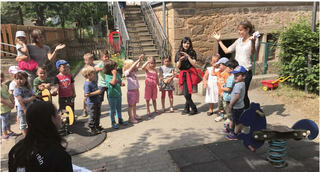
● Kindergarten Ermschwed

Die Handlungsstrategie baut auf den Ergebnissen der Stärken- und Schwächen-Analyse und den Zielen auf und benennt die daraus abgeleiteten zentralen Handlungsfelder und Vorhaben. Die Handlungsstrategie ist das zentrale Element eines integrierten kommunalen Entwicklungskonzeptes.