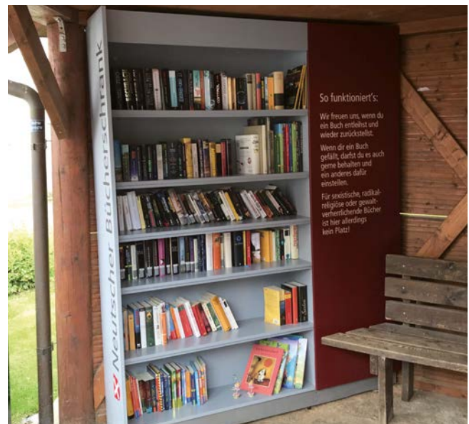
● Bücherschrank Neutsch

Dezentrale Angebote zur Förderung des lebenslangen Lernens können die Attraktivität als Wohn- und Lebensstandort erhöhen. Sie können ggf. durch bestehende Institutionen oder bürgerschaftliches Engagement ausgebaut werden.