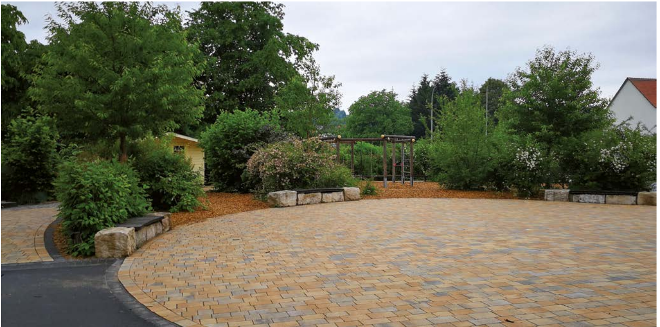
● Schulhof Ober-Schmitten