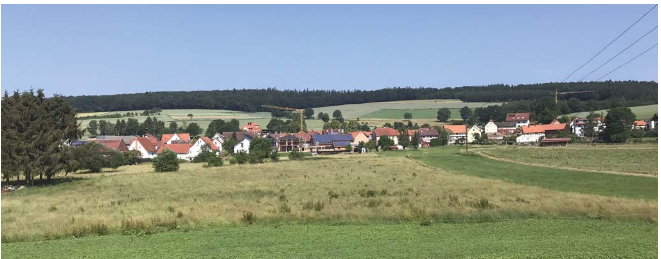
● Neubaugebiet Kathus

Erklärte Zielsetzung der Dorfentwicklung ist die Lenkung der Investitionen in die Ortskerne. Daher sind grundsätzlich nur Investitionen in den Ortskernen förderfähig. Die Richtlinie sieht für private Vorhaben eine Förderung nur in den abgegrenzten Fördergebieten in den Ortskernen und bei Kulturdenkmälern vor. Im IKEK ist die Fördergebietsabgrenzung für private Antragsteller zu erarbeiten. Sie ist aus der Siedlungsgenese abzuleiten und der Gebietszuschnitt sollte unter strategischen Gesichtspunkten (Lage, Struktur, Funktion und Bedeutung, Lenkung der Fördermittel) festgelegt werden.