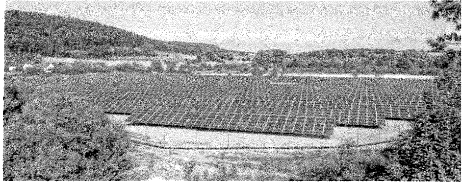
Blick aus südlicher Richtung auf den Solaracker Cölbe.