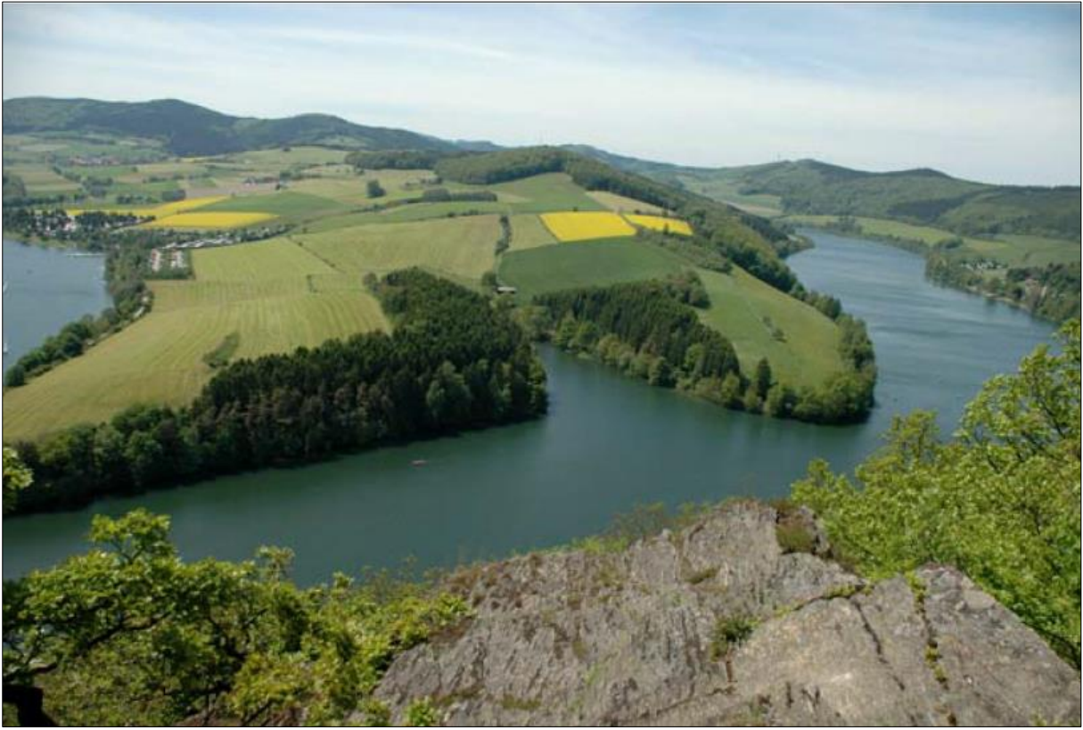
Abbildung 4 Blick aus Richtung des Naturdenkmals auf das Plangebiet