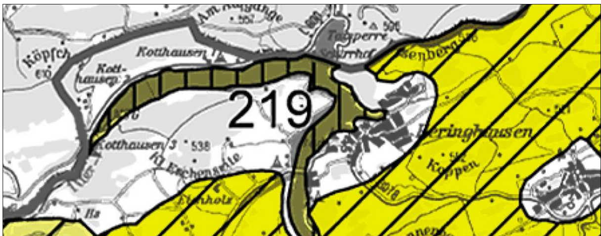
Abbildung 3 Avifaunistische Schwerpunkträume

Aus der Karte zu den avifaunistischen Schwerpunkträumen ist zu entnehmen, dass der räumliche Geltungsbereich kein Gegenstand eines bedeutsamen Brut- und/oder Rastgebiete ist. Der östlich angrenzende Stausee stellt ein regional bedeutsames Rastgebiet und lokal bedeutsames Brutgebiet dar.