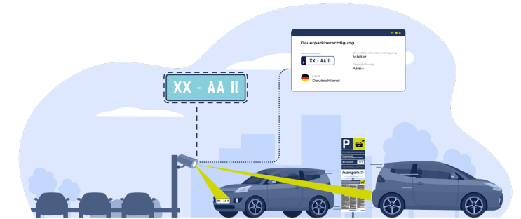
Parken für Berechtigte