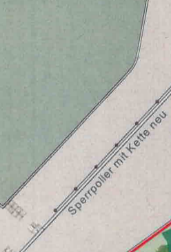
Sperrpoller mit Kette neu