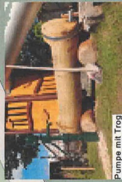
Pumpe mit Trog