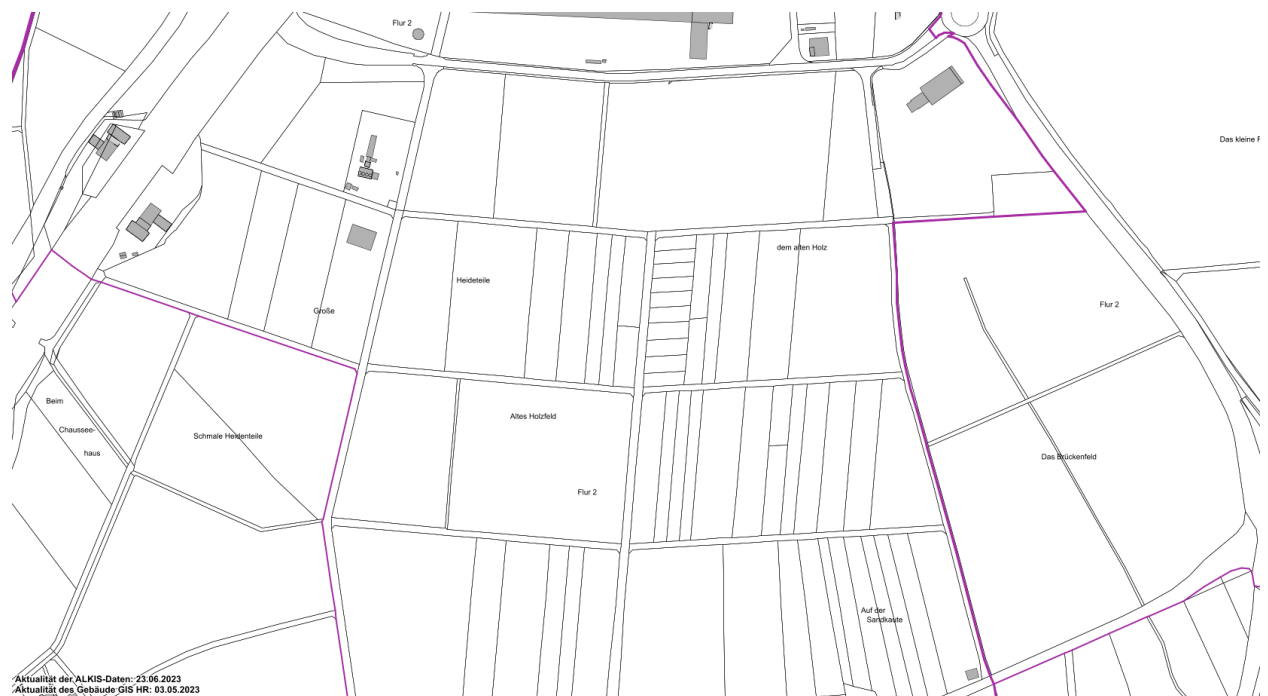
Kartenauszug ohne Maßstab

In der Karte ist das Gebiet dargestellt: