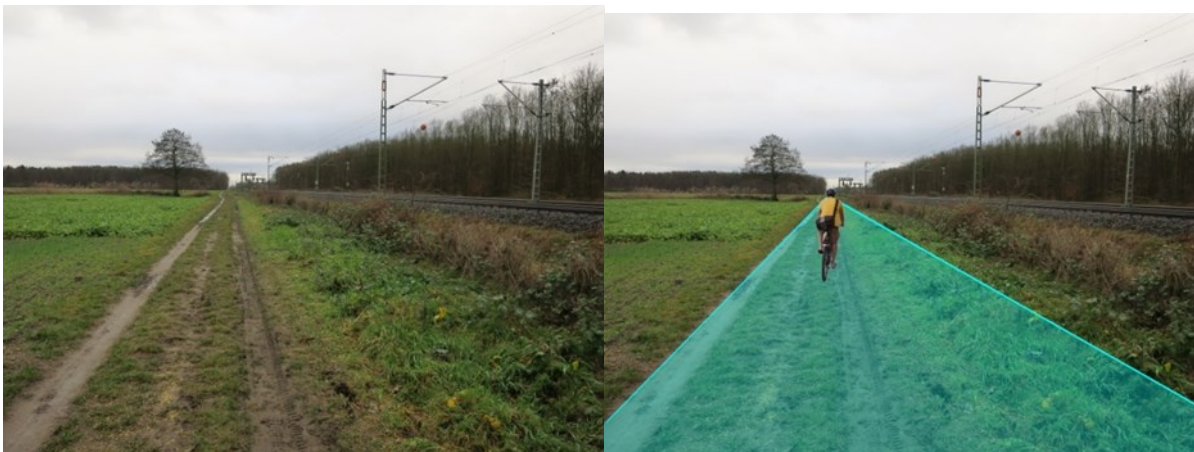
Links Foto 2: Vorhandener bewachsener Feldweg mit einer Breite von circa 3 Metern. Rechts Foto 3: Die Fotomontage zeigt auf, wie der zukünftige Radweg mit einer Breite von 4 Meter verläuft (Fotos aufgenommen am 19.01.2018).