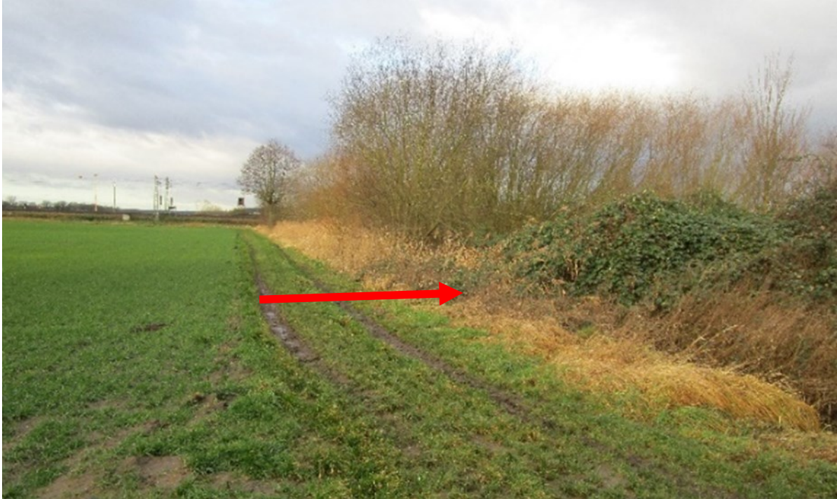
Foto 1: 115 Meter nach Westen verlaufender Weg in Richtung Bahngleise, begleitet von einem schilfbewachsenen Vorfluter. Um den Weg auf vier Meter zu verbreitern, müsste circa einen Meter in das Schilf eingegriffen werden (Foto aufgenommen am 19.01.2018).