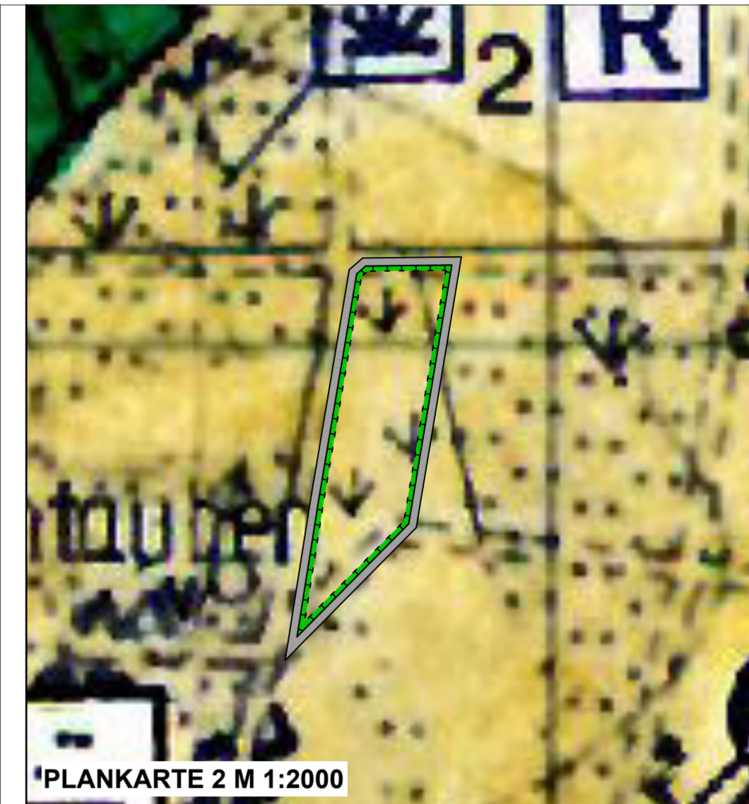
PLANKARTE 2 M 1:2000