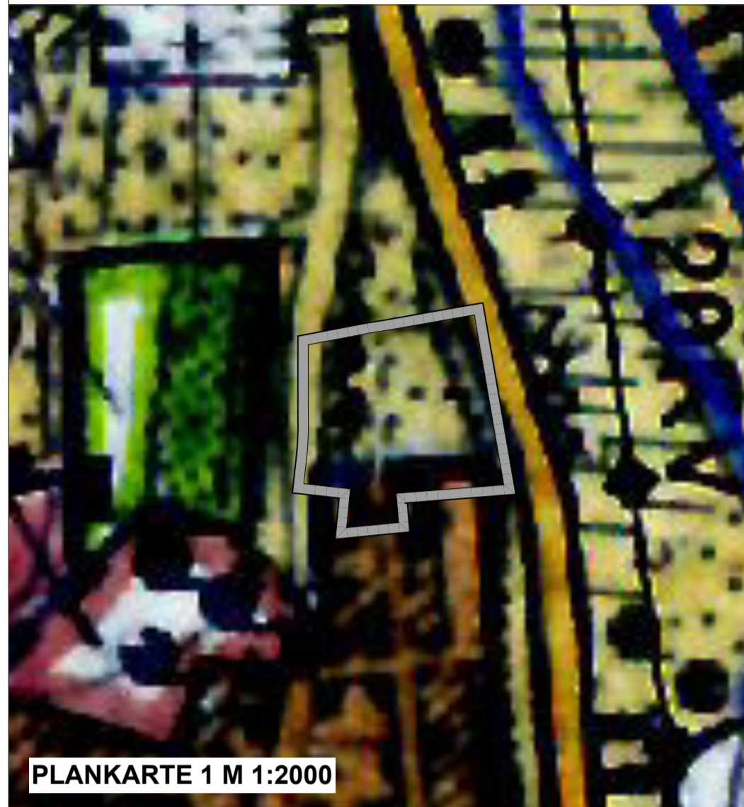
PLANKARTE 1 M 1:2000