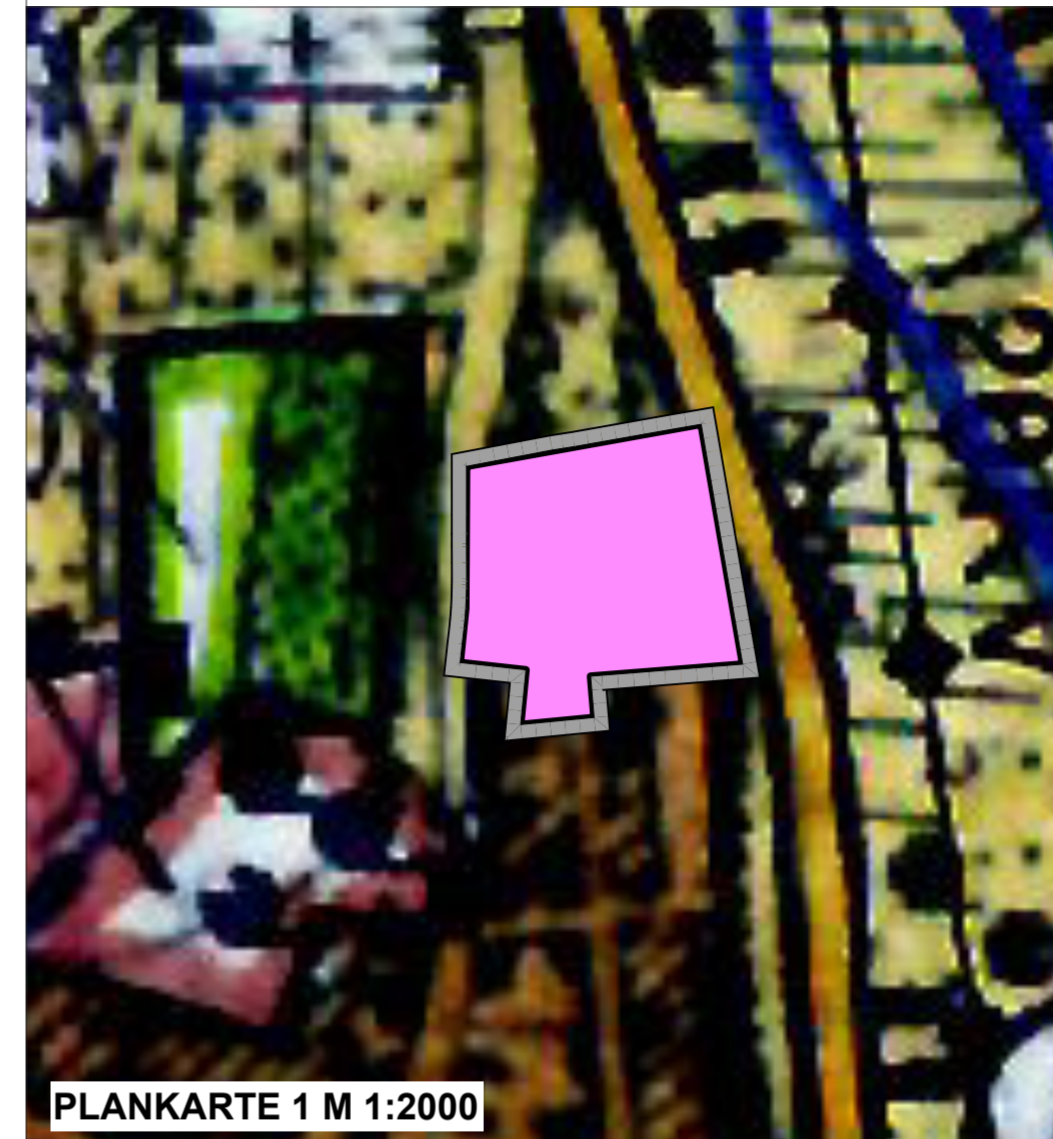
PLANKARTE 1 M 1:2000