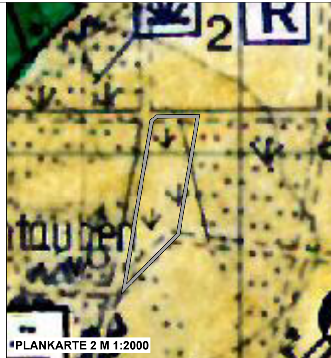
PLANKARTE 2 M 1:2000