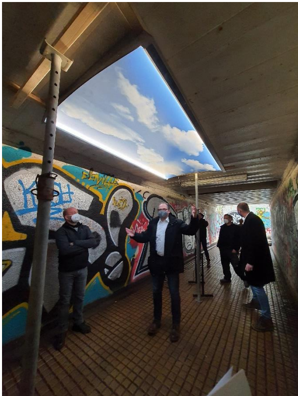
Foto Präsentation Prototyp Deckenleuchte