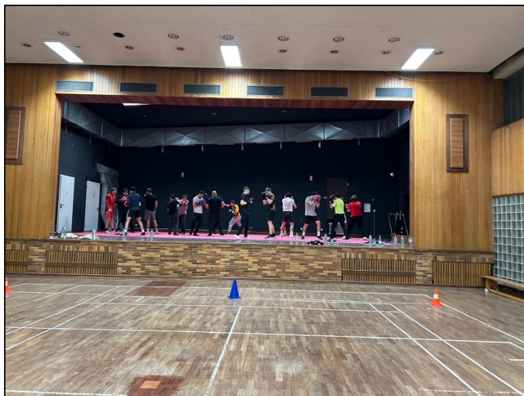
Bild: Box Projekt am 26.01.2025

Kooperationspartner sind die LGS in Dieburg, Berufsbildende Schulen in Darmstadt und das Arbeitsamt Dieburg/Berufsberatung.