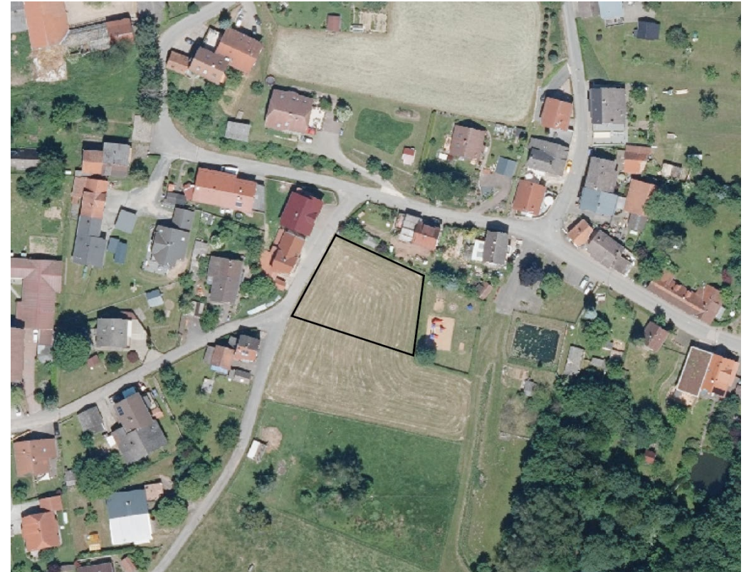
Geltungsbereich der Ergänzungssatzung