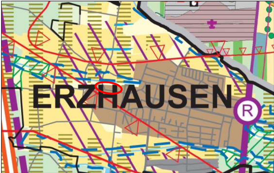
Abb. 3: Ausschnitt (o. Maßstab) aus dem Regionalplan Südhessen (2010)