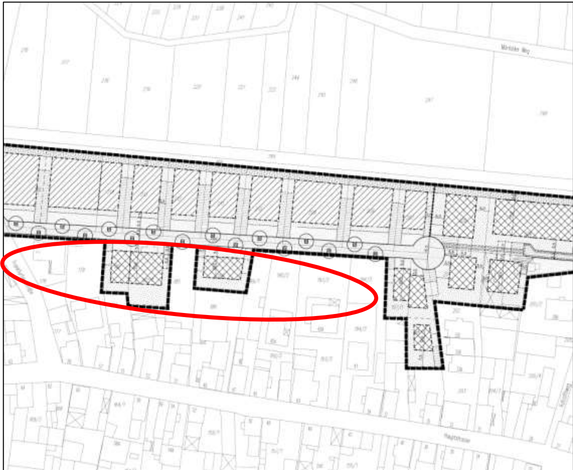
Abb. 5: Ausschnitt (o. Maßstab) aus dem Bebauungsplan „Nördlich Hauptstraße II“ (2005)