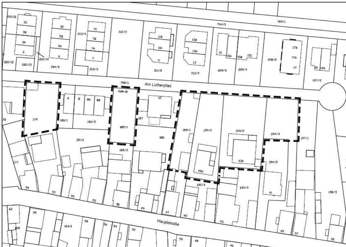
Abb. 2: Geltungsbereich (ohne Maßstab)