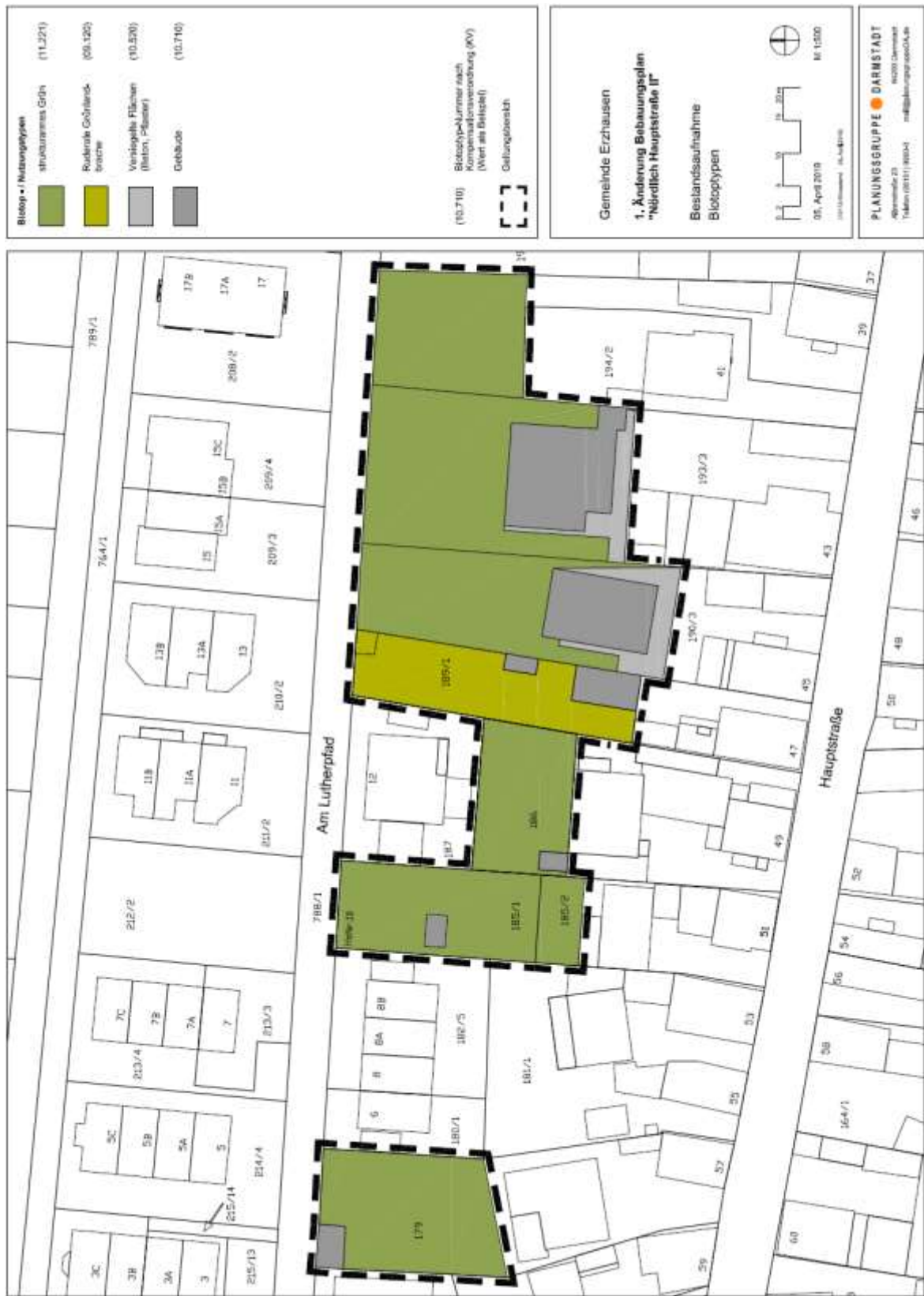
Abb. 1: Bestandsplan Biotoptypen (o. Maßstab),