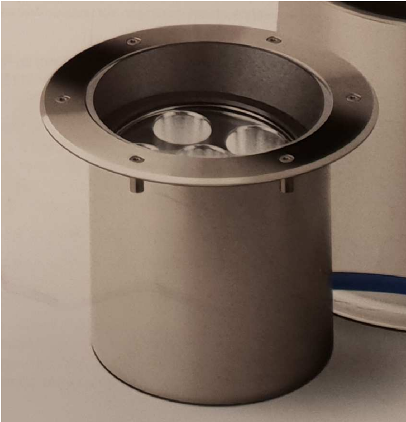
Bodenstrahler mit LED. Farbeinstellung möglich