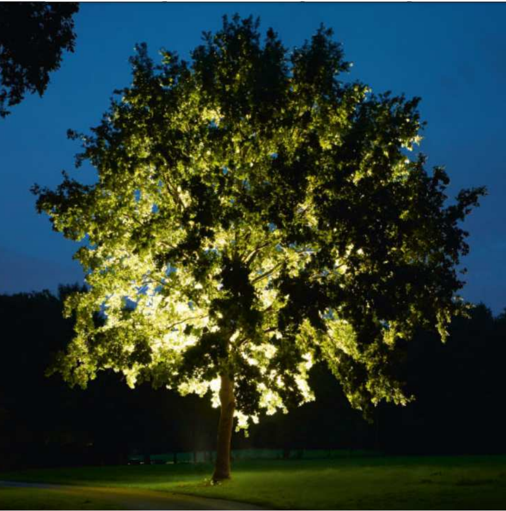
Kombination von Strahlern in die Krone...