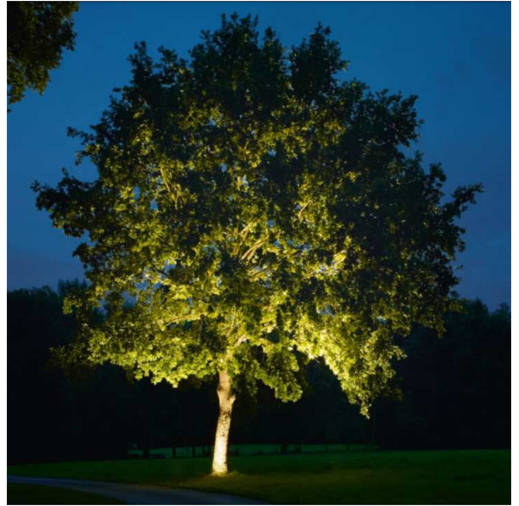
... mit Strahlern im Stammbereich