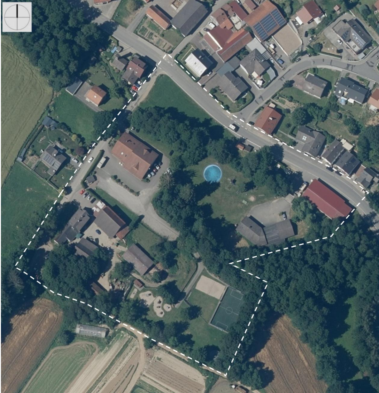
Abbildung 1: Luftbildauszug des Plangebietes

Die Bestandssituation im Plangebiet (gestrichelte, weiße Grenzlinie) und seine räumliche Einbindung in die Umgebungsstrukturen ist dem nachstehenden Luftbildauszug zu entnehmen. Das dargestellte Strukturpotenzial entspricht der Biotopausstattung zum Zeitpunkt der aktuellen Begehungen.