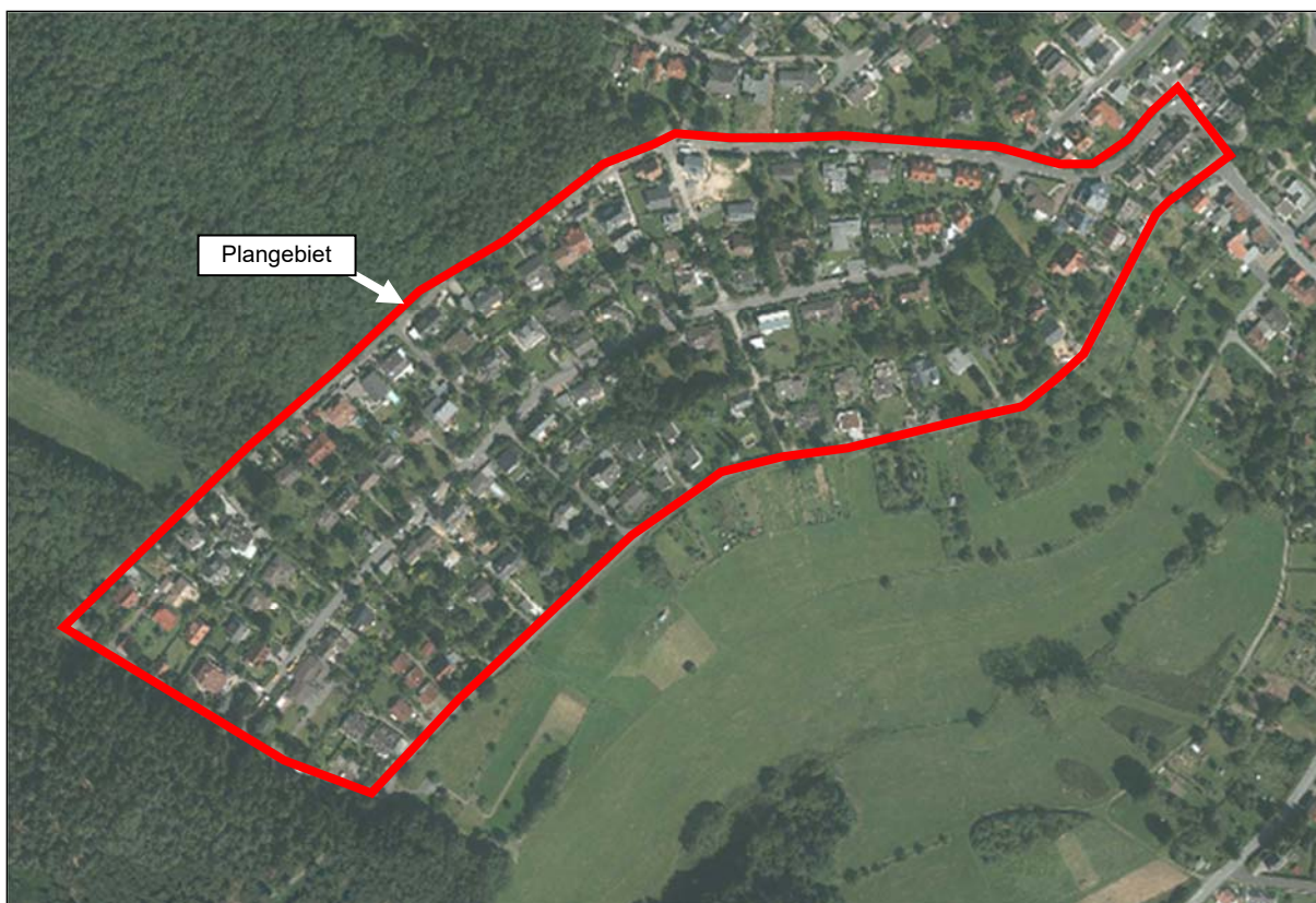
Abbildung genordet, ohne Maßstab

Da in den vergangenen Jahren jedoch zunehmend einzelne Grundstücke weiter unterteilt wurden und eine entsprechende städtebauliche Nachverdichtung erfolgte, deren Fortschreiten weiter abzusehen war, wurde seitens der Gemeinde Glashütten aufgrund der absehbaren Kapazitätsgrenzen der verkehrlichen Erschließung sowie auch der begrenzten Leistungsfähigkeit der Ver- und Entsorgung des Plangebietes das Erfordernis gesehen, die weitere städtebauliche Entwicklung im Zuge der Aufstellung des Bebauungsplanes „Über dem Seegrund“ bauplanungsrechtlich zu steuern und zu ordnen.