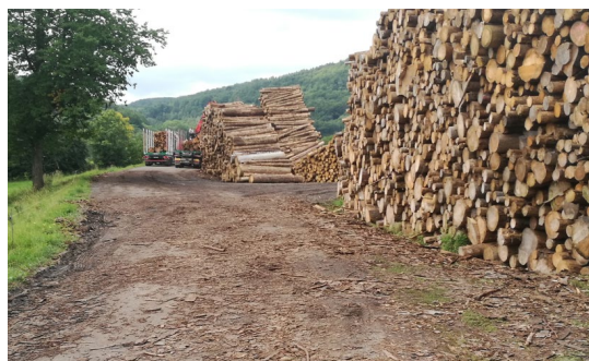
B9 – B12: Unzureichend gesicherte Holzstapel