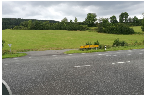
B17: Aufstellort einer Beschilderung