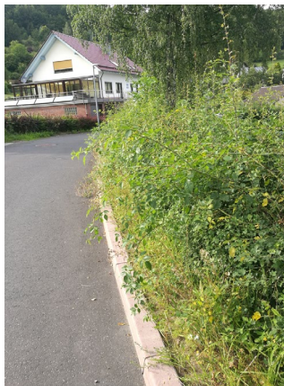
B8: Hecke am Spielplatz „In der Welsebach, oberer Teil“