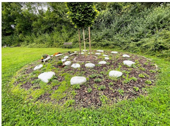
B1: Baumurnengrab mit starkem Unkrautbewuchs