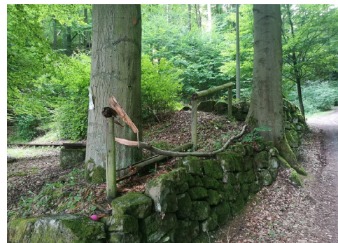
B6: Umgefallenes Geländer; Blickri. Oberer Parkplatz