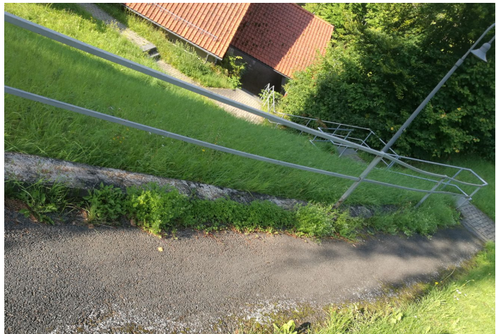
B15: Zustand der Wege über dem DGH