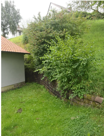
B14: Sprösslinge neben dem DGH