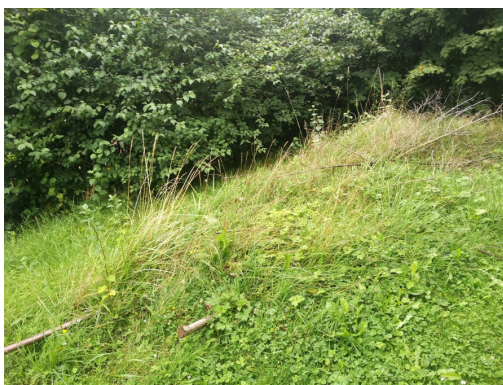
B13: einwachsender Baumschnitt über DGH