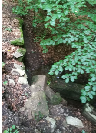
B7: Eingestürzte Brücke über Hollenbach, Tanzplatz