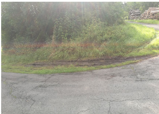
B16: Befahren schwerer LKW alte B451