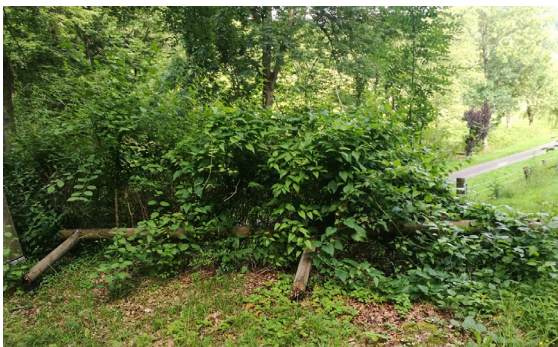
B5: Umgefallenes Geländer Tanzplatz; Blickrichtung Ort