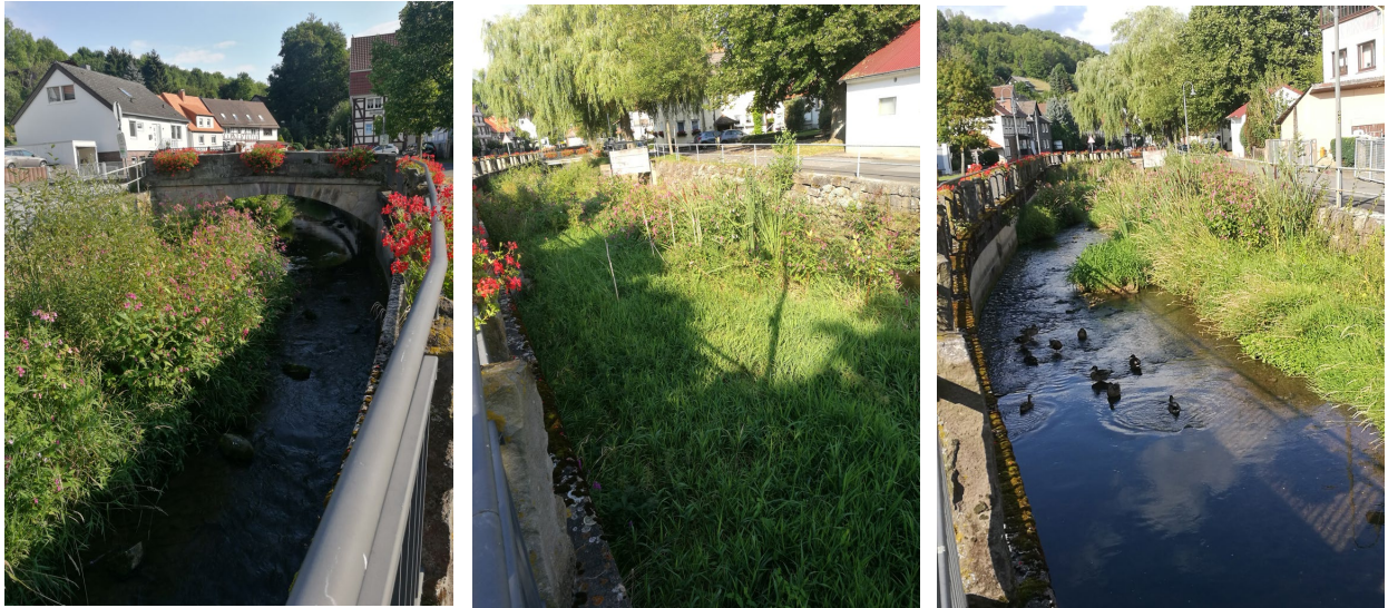
B2 – B4: Desolater Zustand des Gelsterbachlaufs

Im Rahmen dieser Reinigungsarbeiten bittet der Ortsbeirat Trubenhausen auch darum, die Einläufe für das Oberflächenwasser aus den höher gelegenen Gebieten zu prüfen und ggf. Instand zu setzen.