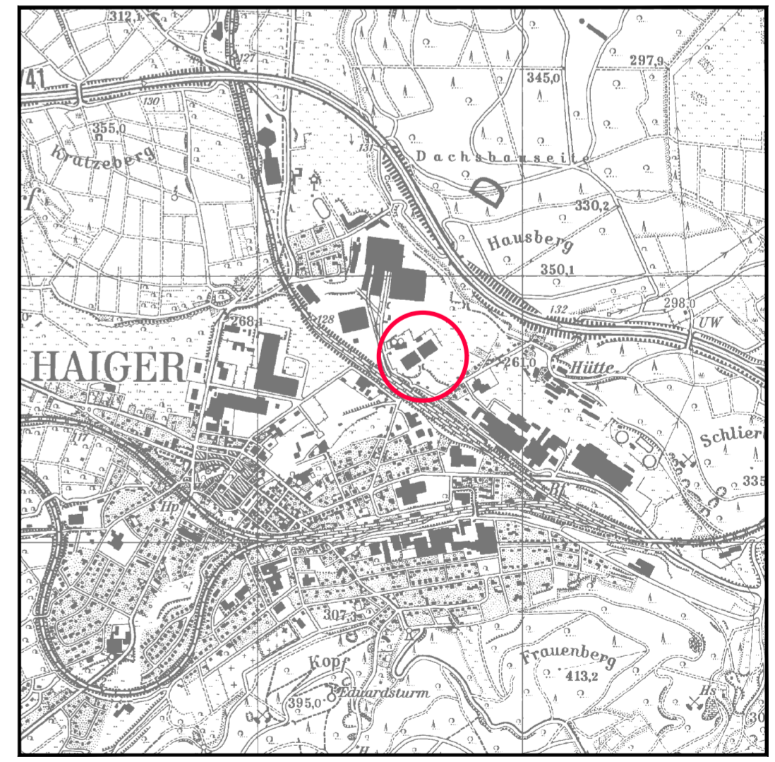
Lage des Geltungsbereiches M1:20.000