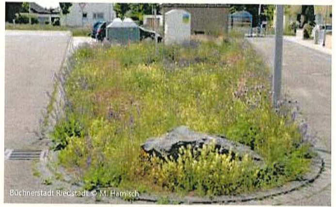
Büchnerstadt Riedstadt