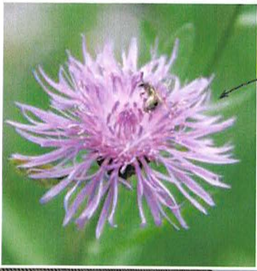
Wildbiene auf Flockenblume