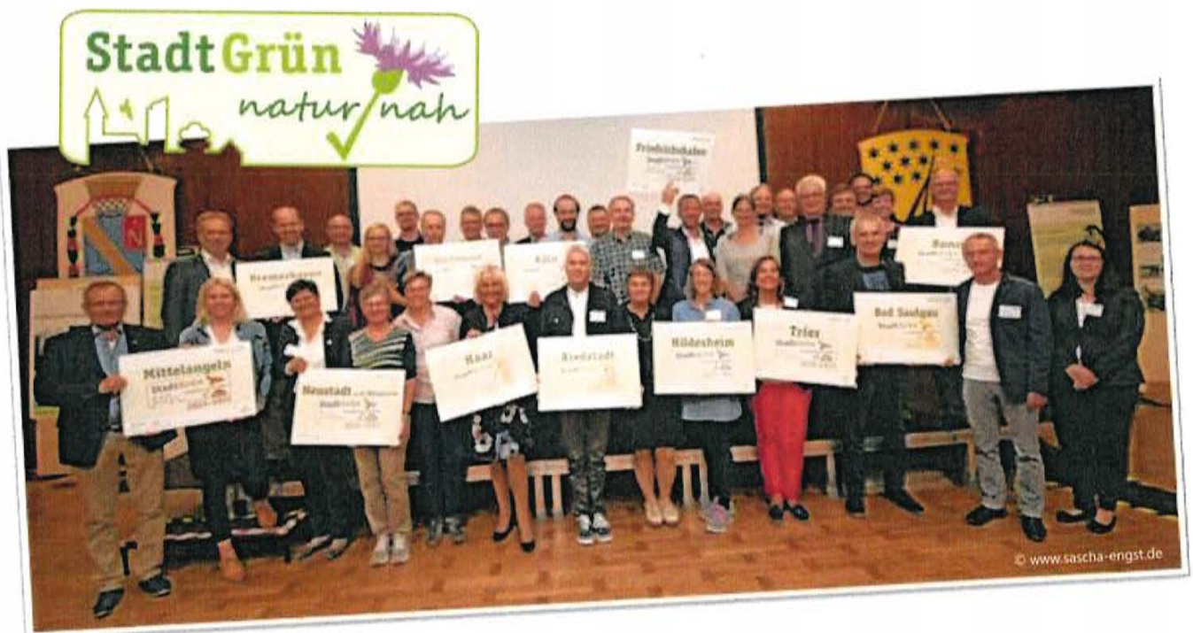
Labelübergabe an 14 Kommunen im Jahr 2019 in Bonn anlässlich des Fachkongresses „StadtGrün naturnah - Handlungsspielräume für mehr Vielfalt im kommunalen Grün“

Das vorliegende Dokument gibt einen detaillierten Überblick zu den Handlungsoptionen von Gemeinden und Städten die biologische Vielfalt innerhalb des Siedlungsraumes zu fördern. Die Bewertung im Rahmen des Label-Verfahrens „StadtGrün naturnah“ erfolgt anhand der bereits erfolgten Aktivitäten und Planungen in den skizzierten Spielräumen.