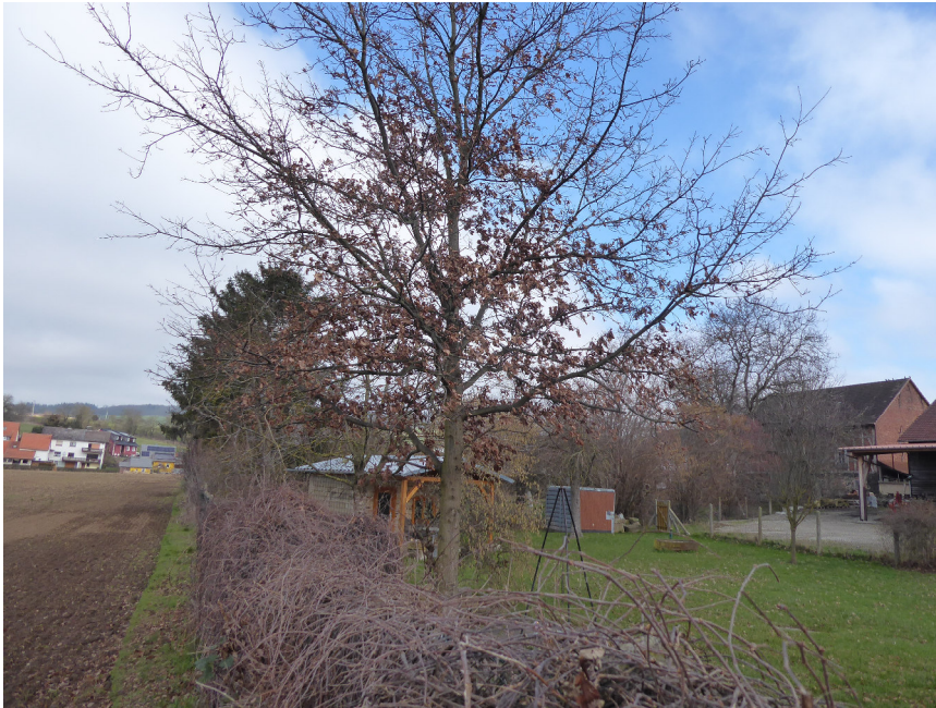
Abb. 3: Geplantes Baugrundstück

Der Geltungsbereich der Satzung wird derzeit als Garten mit großenteils intensiven Rasenflächen genutzt. Auf der Fläche befindet sich eine alte Eiche, die erhalten werden muss. Weiterhin befinden sich dort einige jüngere Gehölze (Hainbuche, Eiche, Kirsche), die ebenfalls erhalten oder auf dem Flurstück umgesetzt werden sollen.