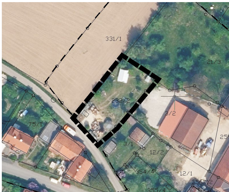
Abb. 2: Lageplan mit Luftbild

Das Plangebiet liegt am westlichen Ortsrand von Mardorf. Der Geltungsbereich umfasst das Grundstück Gemarkung Mardorf Flur 7 Flurstück 332/2 entsprechend dem oben dargestellten Übersichtsplan. Die Größe des Geltungsbereiches beträgt ca. 830 m 2 .