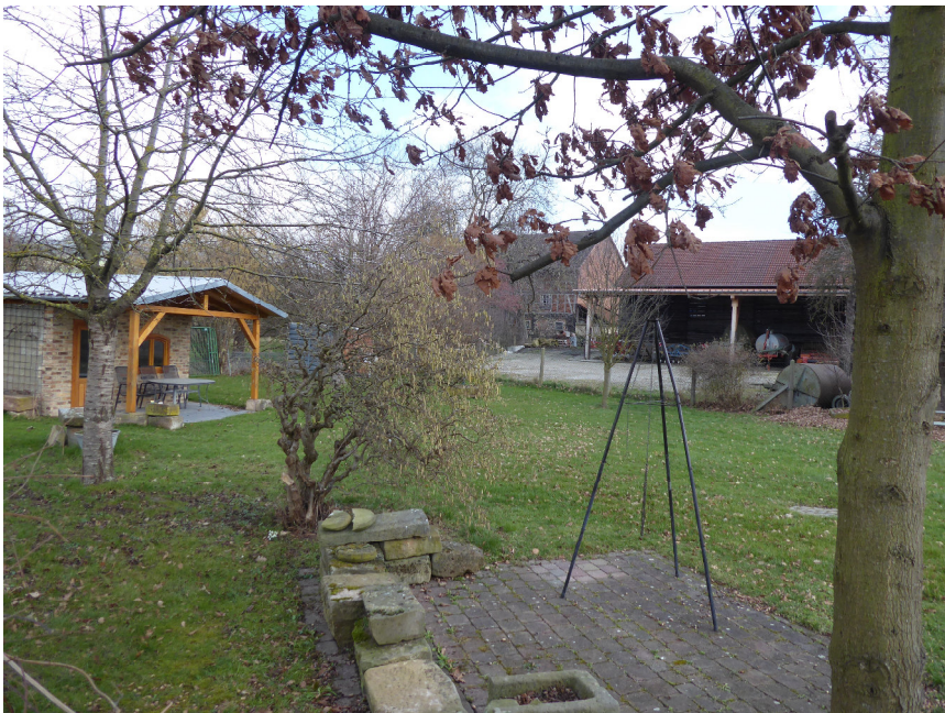
Abb. 4: Geplantes Baugrundstück mit Gartenhütte