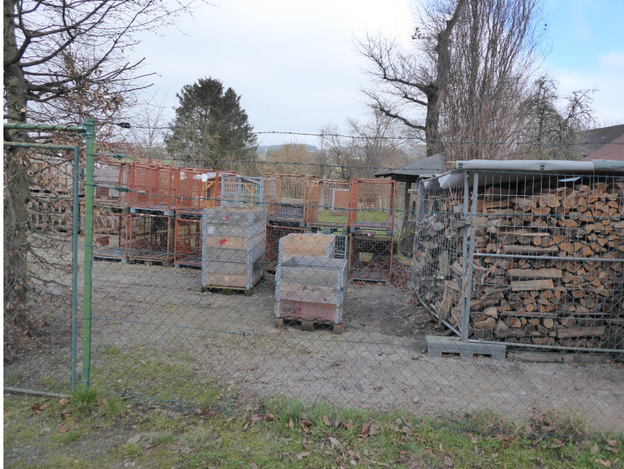
Abb. 5: Eingangsbereich mit befestigter Fläche

Im hinteren Gartenbereich steht eine Gartenhütte auf einer Fläche von ca. 5 x 6,5 m, weiterhin befindet sich hier ein befestigter Grillplatz (ca. 10 m 2 ). Der Eingangsbereich ist z.T. auf einer Fläche von ca. 160 m 2 befestigt und wird als Lagerfläche genutzt.