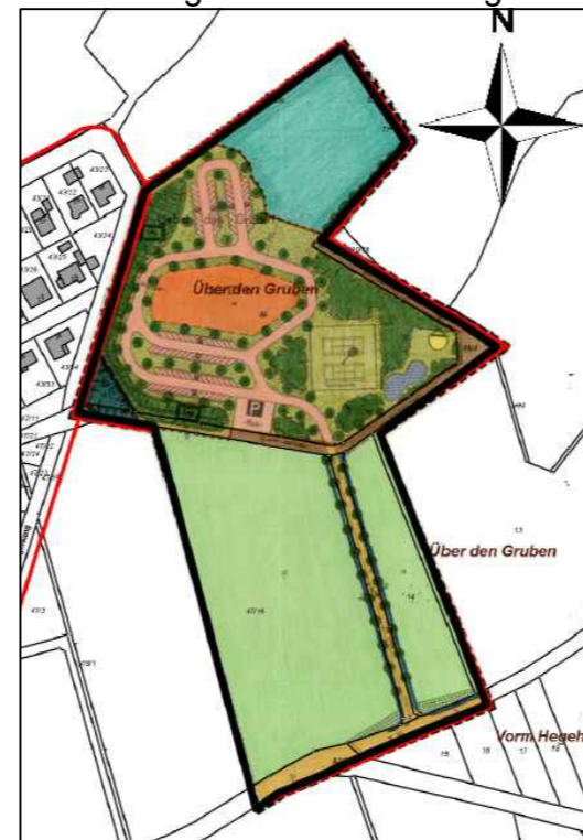
Darstellung des Bebauungsplanes Nr. 3 für den Stadtteil Welferode vom 07.12.1995

Der im Plan verzeichnete Geltungsbereich "Aufhebung" gilt für den gesamten Geltungsbereich des Bebauungsplanes Nr. 3 für den Stadtteil Welferode. Der Bebauungsplan Nr. 3 für den Stadtteil Welferode wird aufgehoben. Die Festsetzungen des Bebauungsplanes finden auf den Geltungsbereich "Aufhebung" keine Anwendung mehr.