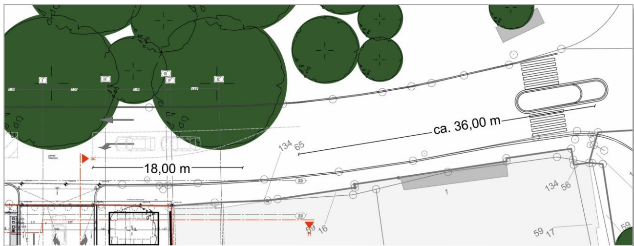
Abbildung 1: Bereich zwischen Parkdeck-Ausfahrt und Minikreisverkehr 1

nicht auf den Überweg fahren, wenn sie auf ihm warten müssten.“ Aber auch bei dieser Berücksichtigung ist die Aufstelllänge gewährleistet.