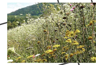
Böschungen, Straßenbegleitgrün (Blumen 30% / Gräser 70%)