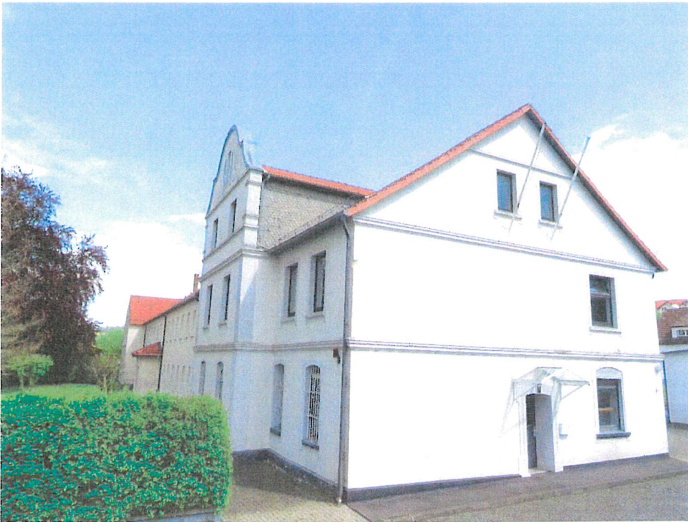
Homberg Bild 2