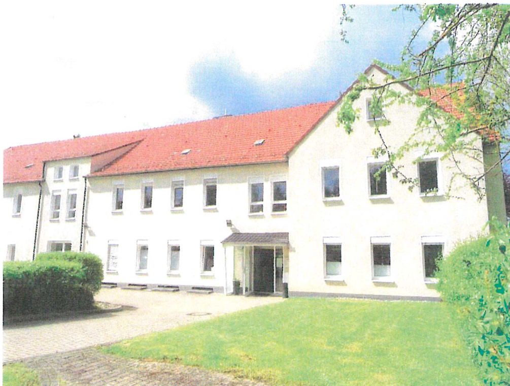
Homberg Bild 6