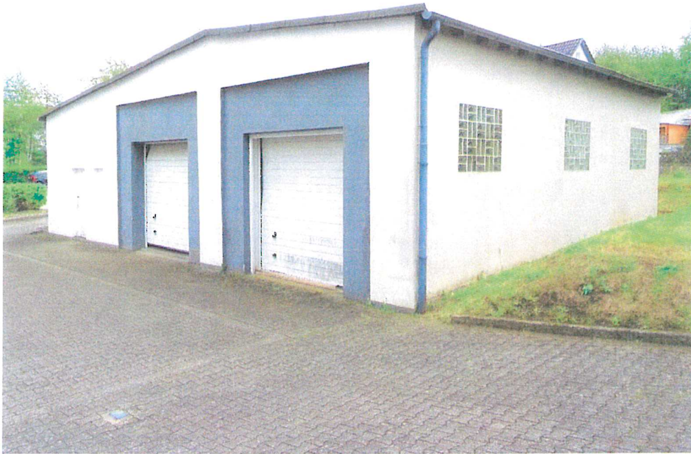
Homberg Bild 8