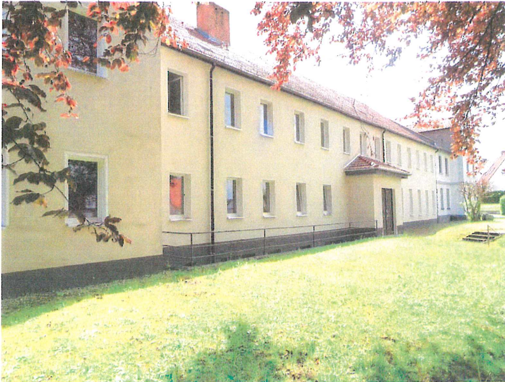
Homberg Bild 4