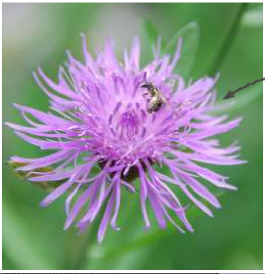
Wildbiene auf Fleckenblume