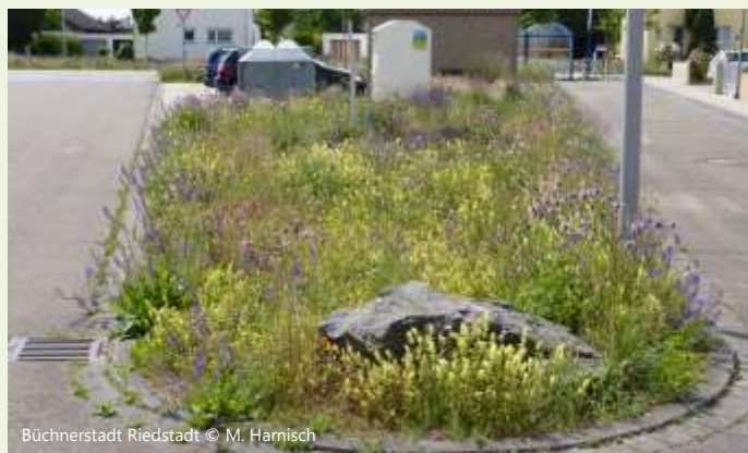
Büchnerstadt Riedstadt