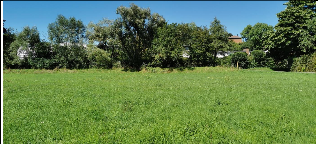
Abbildung 3: Ufergehölze am Rotsgraben