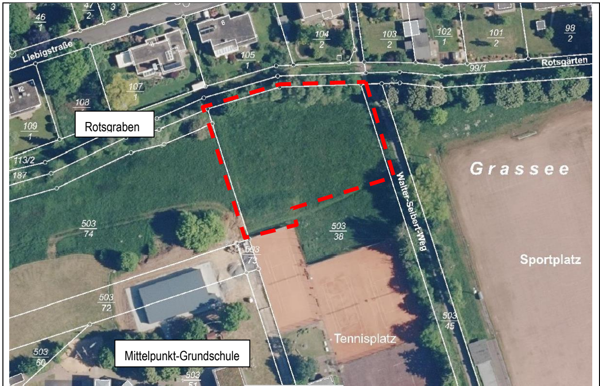
Abbildung 2: Biotopstruktur im Geltungsbereich (rot) und seinem Umfeld

Im Geltungsbereich des Bebauungsplanes sind die folgenden, wesentlichen Biotop- und Nutzungstypen festzustellen (Angaben in Klammern: Code gemäß Anlage 3 der Kompensationsverordnung Hessen, KV):