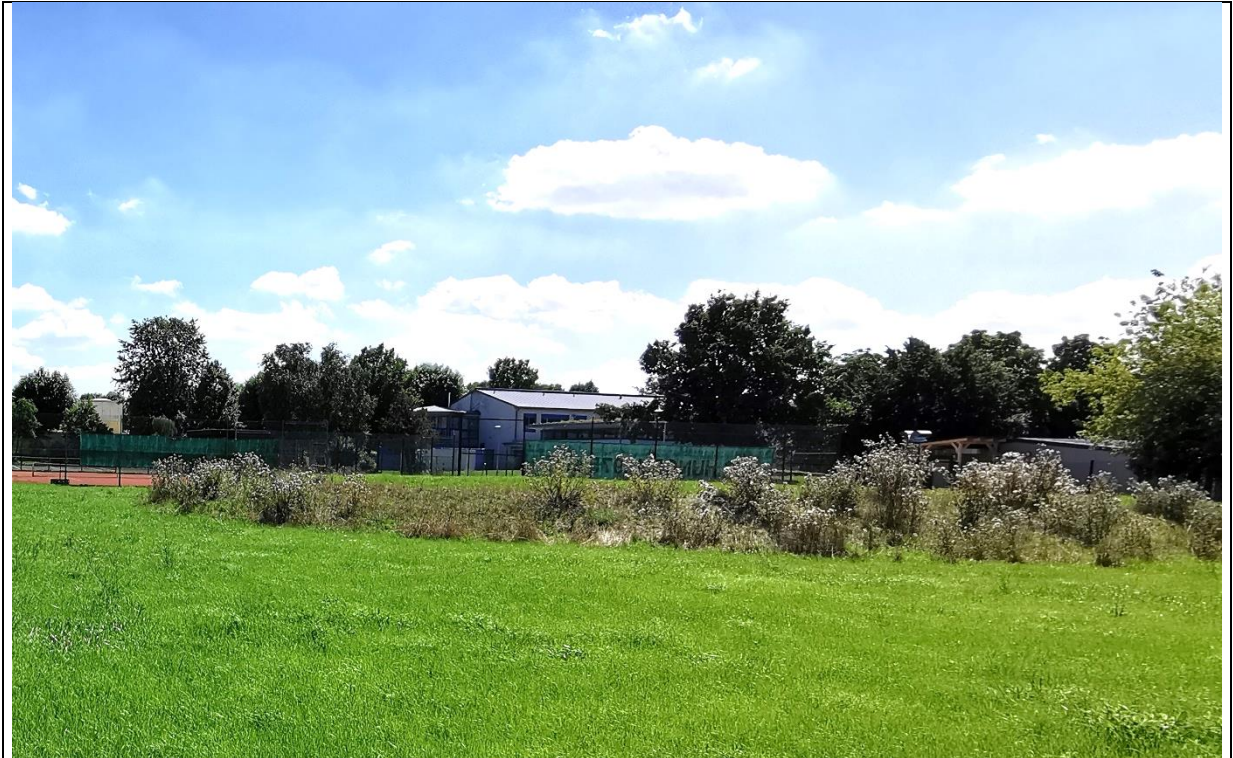
Abbildung 5: Ruderalflur am südlichen Rand des Planungsgebietes

angesiedelt. An den Seiten des Hügels wachsen Kratzdistel ( Cirsium vulgare ), Weißer Steinklee ( Melilotus albus ), Schmallblättriges Greiskraut ( Senecio inaequidens ), Ackerwinde ( Convolvulus arvensis ), Saat-Mohn ( Papaver dubium ) und Klatsch-Mohn ( Papaver rhoeas ). Der Boden ist in diesem Bereich teils unbewachsen und steinig-sandig. Auf der Kuppe des Hügels ist ein kleines Plateau, das zur Zeit der Vegetationsaufnahme mit jungen Gräsern bewachsen war.