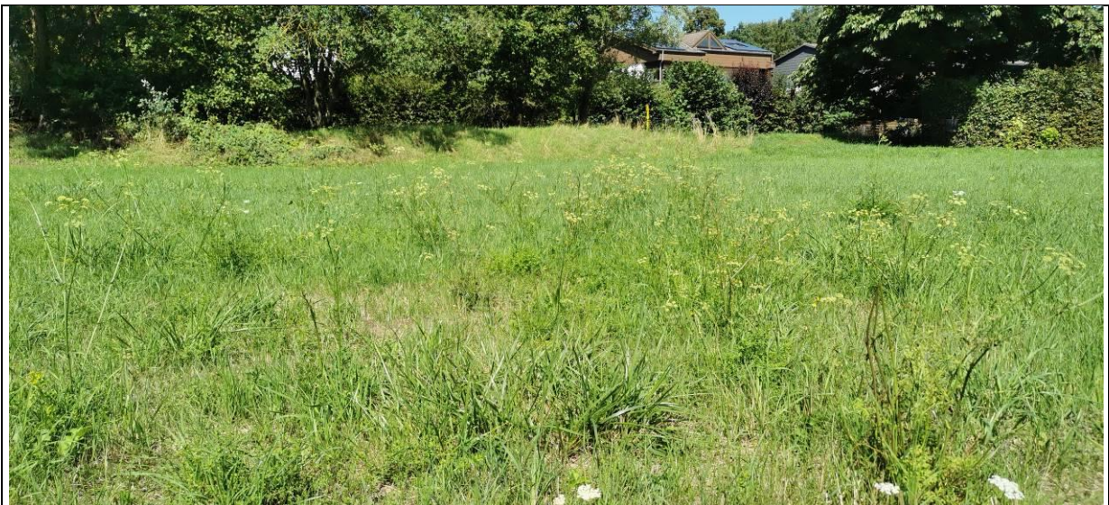
Abbildung 4: Artenarme Feuchtwiese mit Wiesen-Silge

Das Planungsgebiet besteht hauptsächlich aus einer an Kennarten verarmten Feuchtwiese (intensiv genutzte Feuchtwiese - 06.116). Die Wiese ist durch Gräser dominiert, stellenweise ist die Vegetation lückig. Typische Wiesenarten wie Wiesensilge ( Silaum silaus ), Wiesen-Flockenblume ( Centaurea jacea ), Gemeiner Bärenklau ( Heracleum sphondylium ), Pastinake ( Pastinaca sativa ), Wiesen-Bocksbart ( Tragopogon pratensis ), Echtes Labkraut ( Galium verum ) und Kleine Bibernelle ( Pimpinella saxifraga ) kommen nur vereinzelt vor, wie auch ruderalen Arten, z. B. Rainfarn ( Tanacetum vulgare ), Krauser Ampfer ( Rumex crispus ), Kratzdistel ( Cirsium vulgare ), Kompass-Lattich ( Lactuca serriola ) und Brennnessel ( Urtica dioica ). Wiesensilge und Wasser-Knötterich ( Persicaria amphibia ) kennzeichnen die wechselfeuchten bis zeitweise nassen Standortverhältnisse und deuten den Feuchtwiesencharakter an.