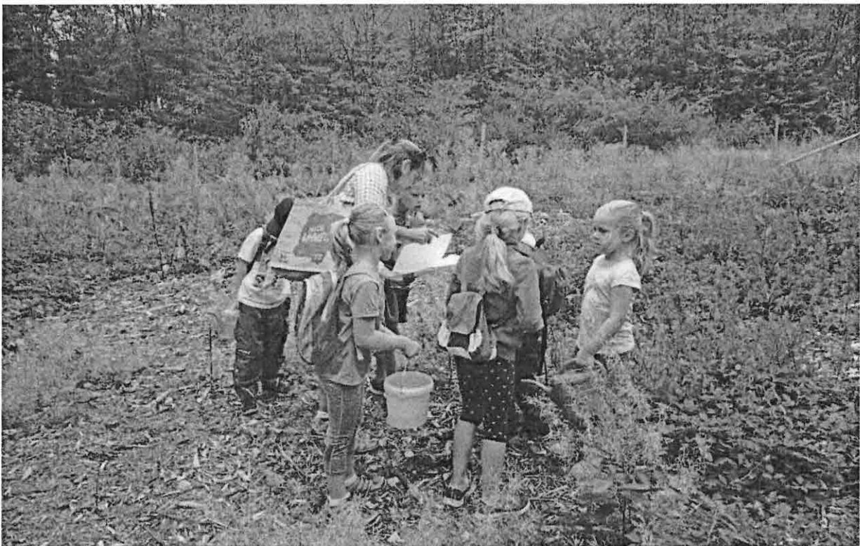
Wo ist denn mein Bäumchen?