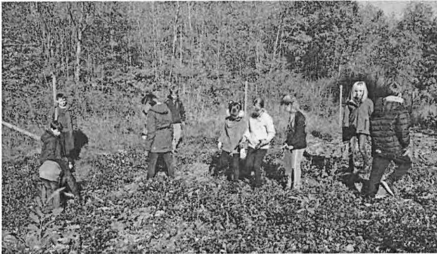
Die Schüler bei ihrem Pflegeeinsatz