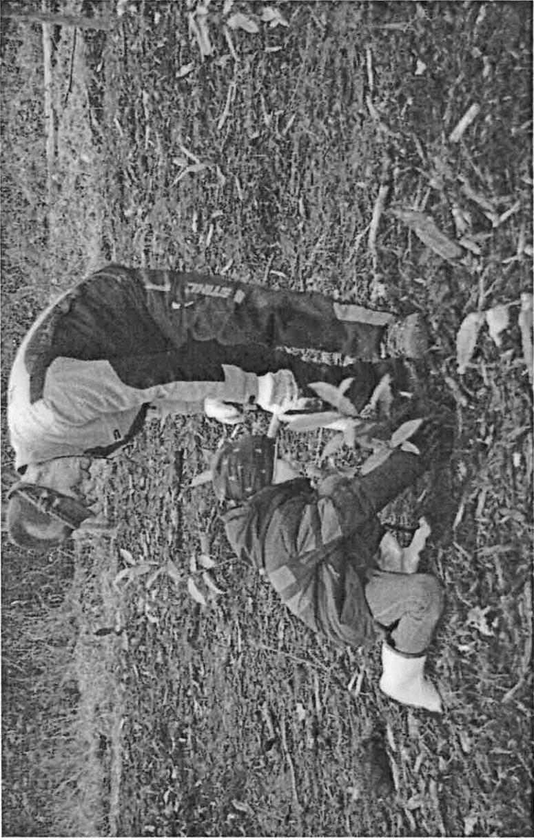
Der Forstwart erklärt wie man pflanzt.