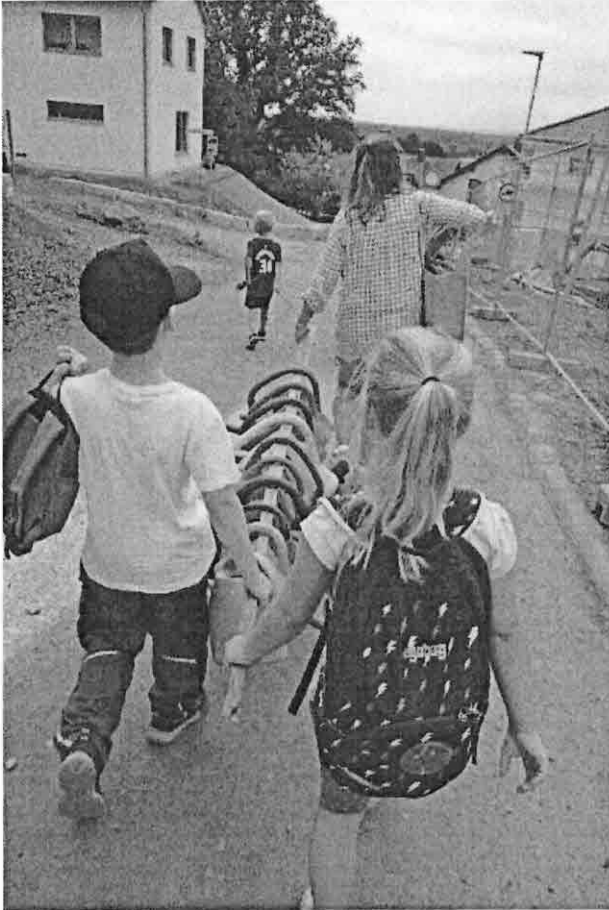
Nach der Bewässerungsaktion geht es zurück zur Vogelschutzhütte.