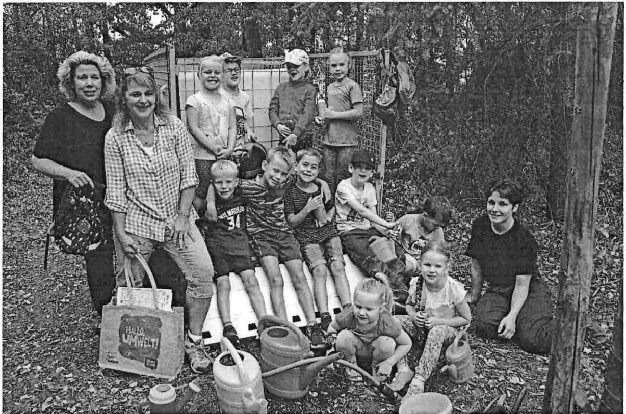
Das hat richtig Spaß gemacht.