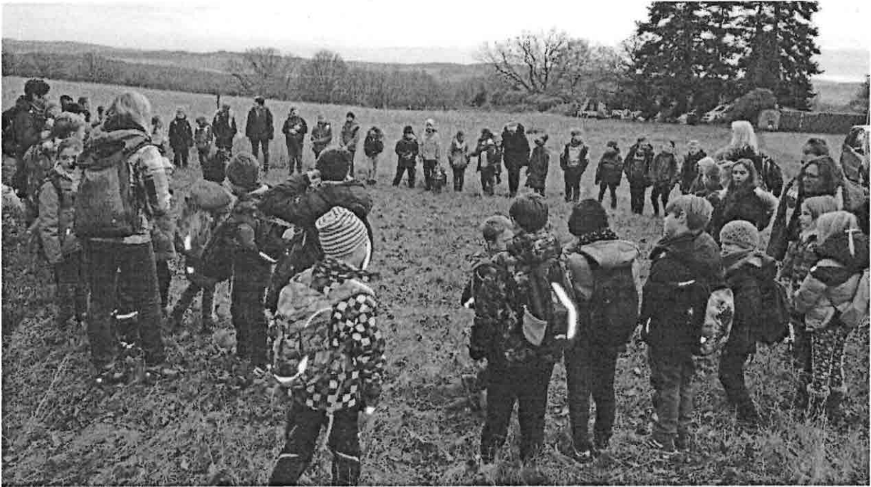
20. November 2021 // Die Klassen 1 - 4 der Grundschule wanderten nach Nonnenroth um an der Pflanzaktion teilzunehmen. Tolle Leistung!