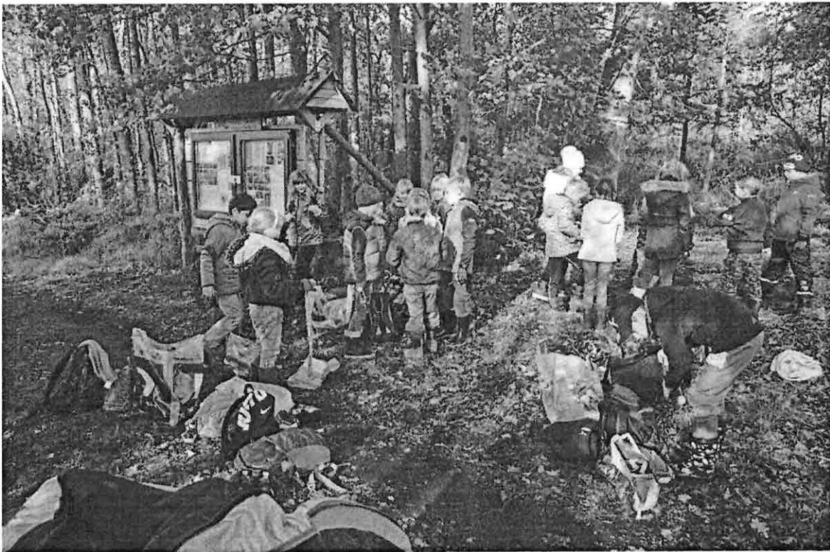
Oktober 2022/2023 Mehrere Klassen wanderten nach Nonnenroth um Pflegearbeiten zu tätigen.