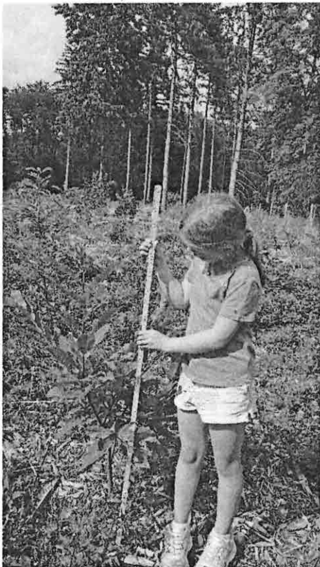
Die Größe des Bäumchens wird gemessen und im Tagebuch notiert.