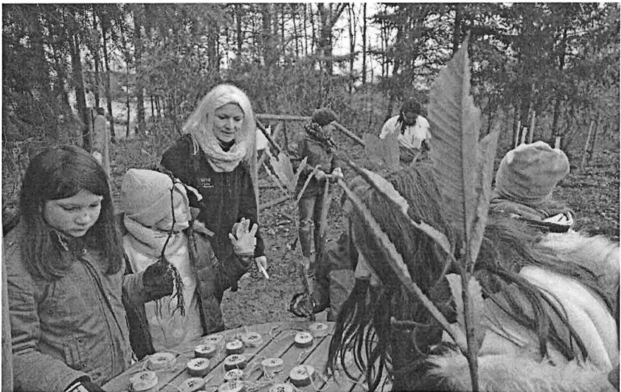
Die Kinder suchen sich ihre Lieblingszahl für den zu pflanzenden Baum.