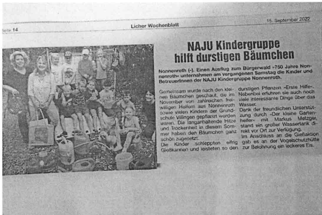
Die Presse berichtete über das Wässern der Bäumchen.