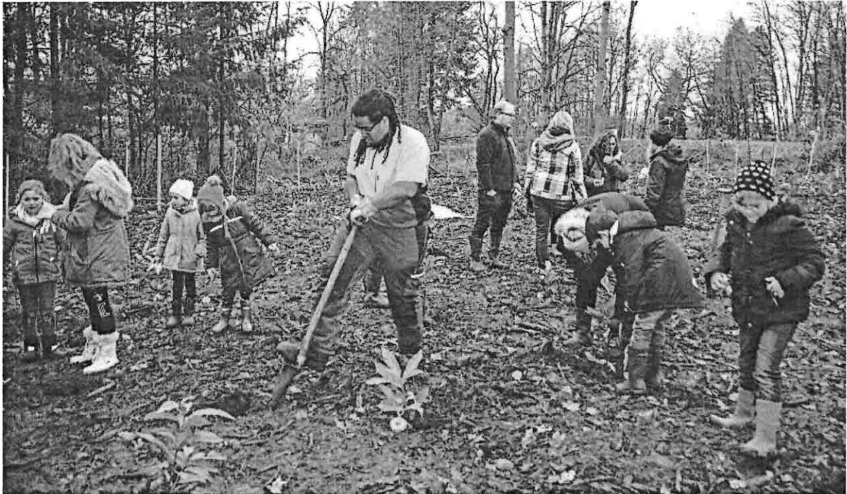
Die Pflanzlöcher in den steinigen Boden zu graben war nicht einfach.