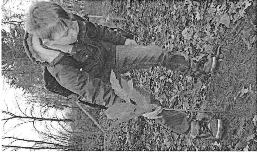
Hier arbeiten Profis!