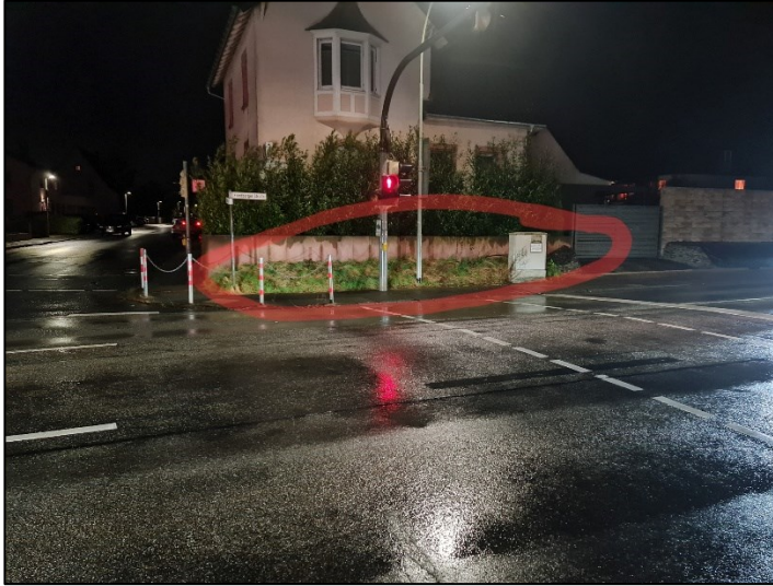
Fläche an der Ampel der B3 (Okarben)