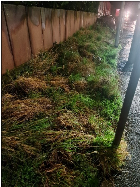
Zustand der Fläche (Feb 2024)