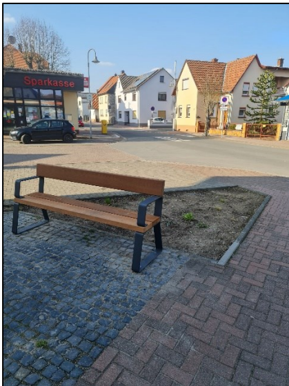
Potentielle Fläche für eine Baumpflanzung

Es wird ausdrücklich begrüßt, dass der Platz am Brunnen vor der ehemaligen Apotheke grundhaft neugestaltet wurde. Neben modernen und altersgerechten Sitzbänken, sind auch die Blumenbeete neu bepflanzt worden. Zur Vollendung des Ensembles, welches bereits viel Anklang bei den Okärbem gefunden hat, fehlt lediglich ein Baum. Dieser sollte nicht „harzend“ sein, damit parkende Autos und Nutzer der Sitzbänke nicht beeinträchtigt werden. Darüber hinaus sollte ein Holzpfahl zur Sicherung des Baumes verwendet werden.