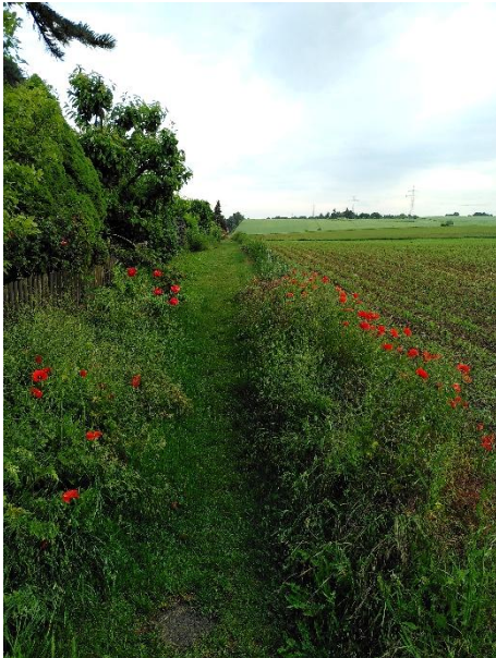
Abb. 8: Südlich der Einmündung Hanauer Str.: individuell hinter einzelnen Häusern gemäht