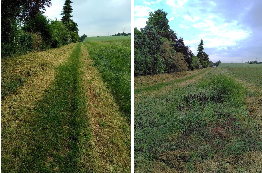
Abb. 1–7: Nördlich der Einmündung Hanauer Str.: durchgängig gemäht