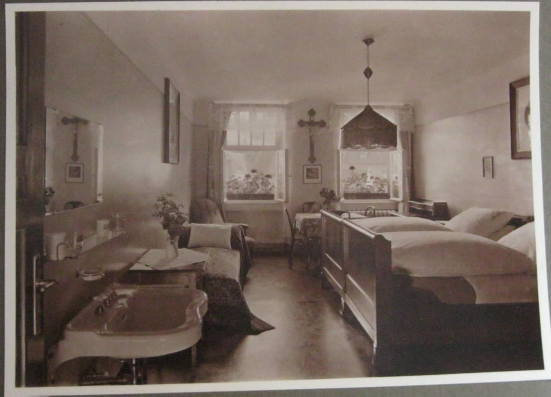
Ansicht eines Patientenzimmers ca. 1925