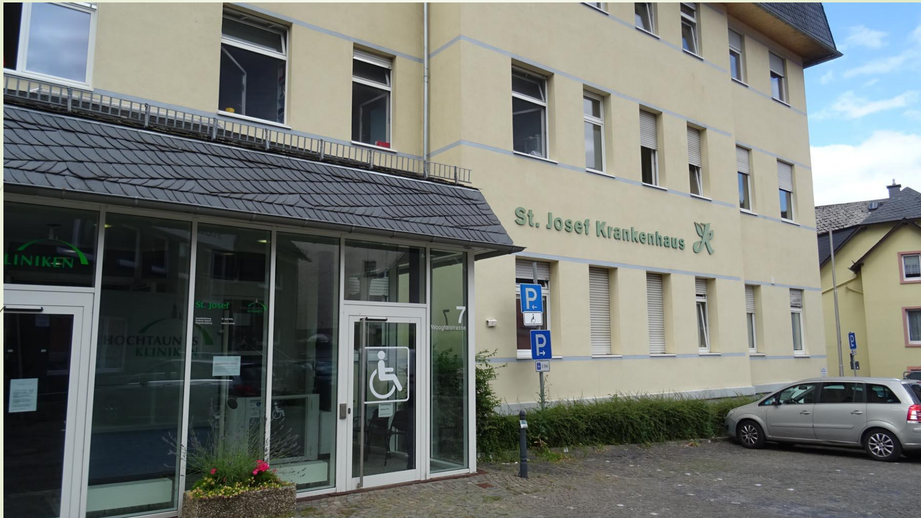
Die heutige Ansicht