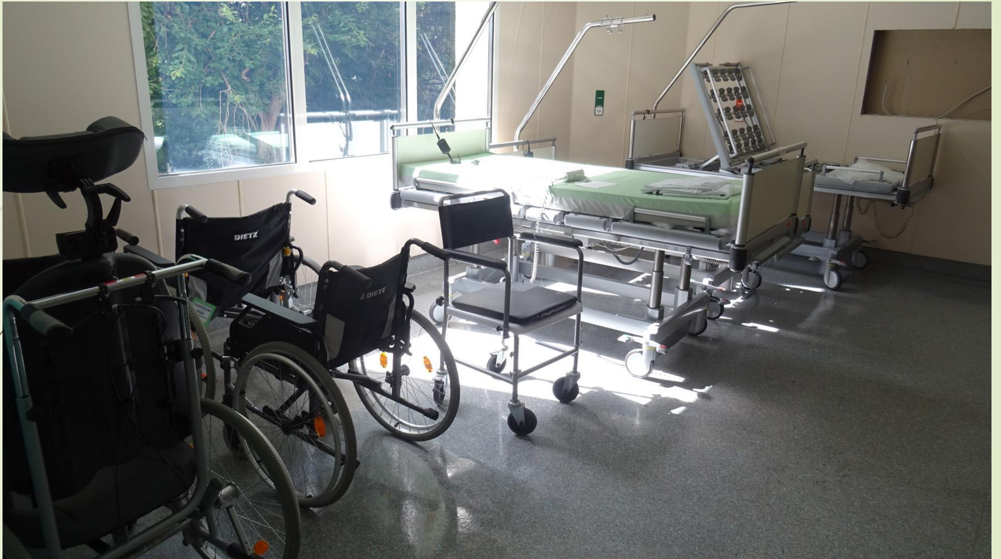
Betten- und Hilfsmittellager