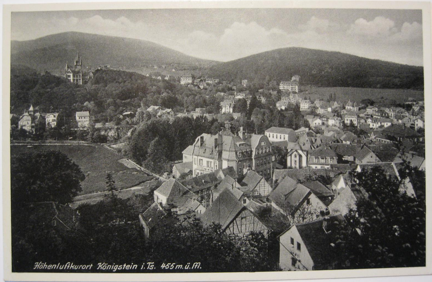
Blick von der Burg ca. 1920 auf das Krankenhaus und die Altstadt