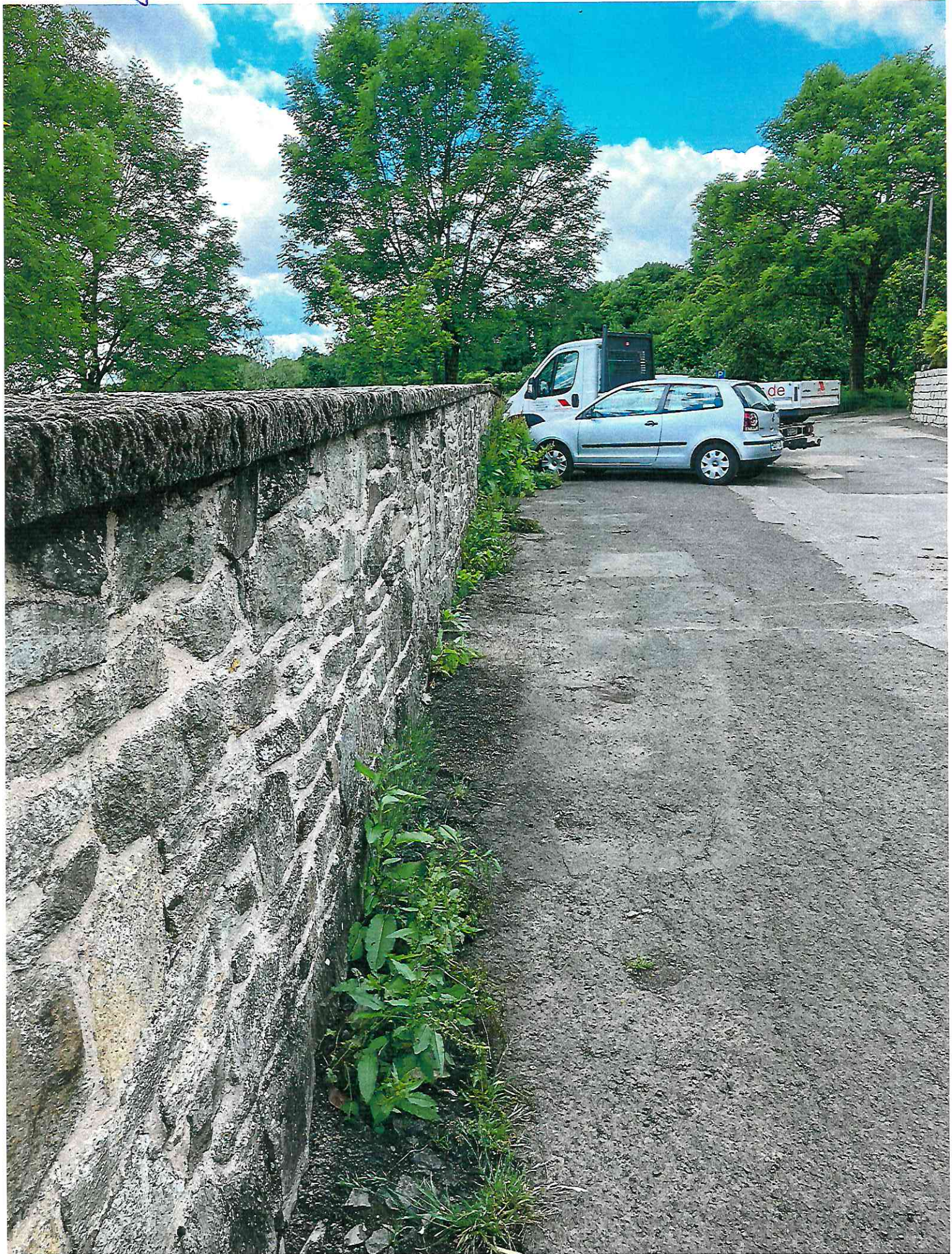
Anlage zu Top 3.6