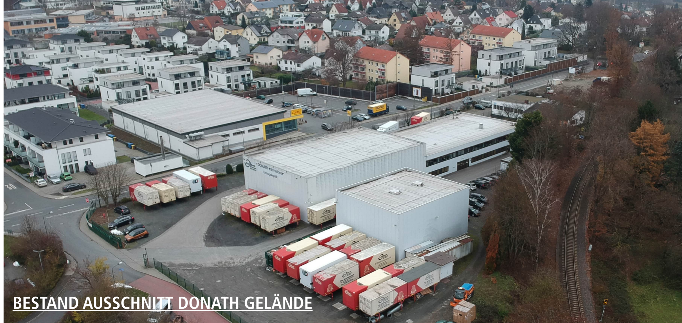
BESTAND AUSSCHNITT DONATH GELÄNDE

Nutzung überwiegend Lager- möglichkeit für Umzugsgut.