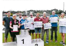
2018 & 2021 Top 50 des DLV