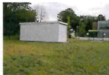
Garage für den Betriebshof (2014)