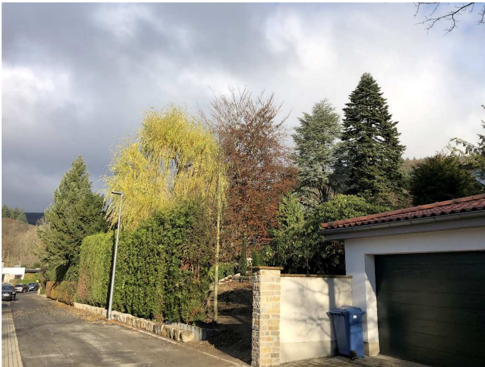
Abb. 2: Älterer Baumbestand östlich der Straße „Am Ellerhang“, 22.11.2021

Die Potenzialabschätzung basiert auf einer Begehung der Fläche am 21. November 2021 vormittags. Dabei konnten nur wenige – meist unbebaute - Grundstücke betreten werden, alle anderen wurden nur von den im oder um das Gebiet verlaufenden Straßen und Fußwegen aus beurteilt.