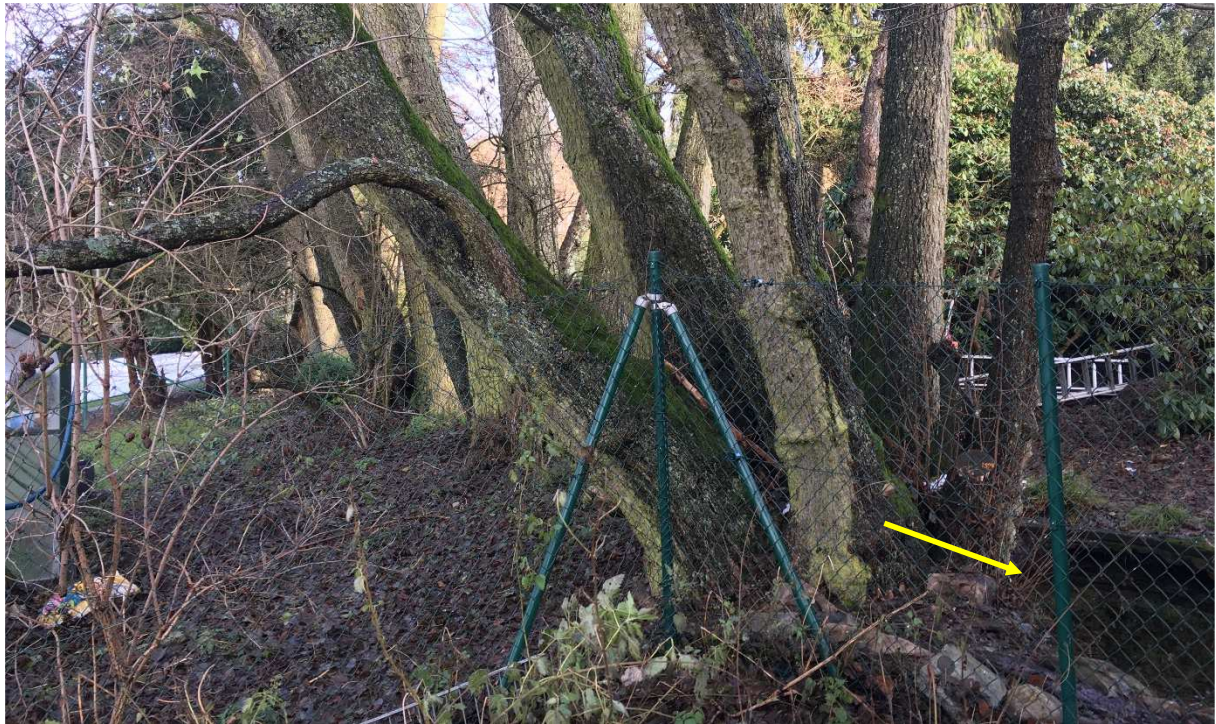
Abb. 7: Bachverlauf im mittleren Abschnitt mit randlicher nichtheimischer Bepflanzung (Rhododendron) sowie Uferverbau.