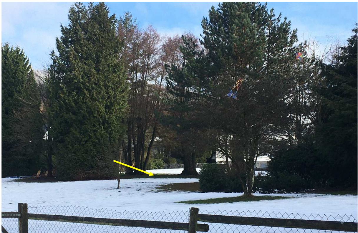
Abb. 8: Bachverlauf im nördlichen Abschnitt mit Intensivrasen beidseits des Gewässers sowie randlicher nichtheimischer Bepflanzung (Thuja u.ä.).