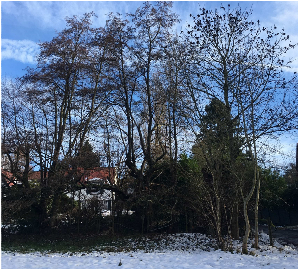
Abb. 9: Gewässerab- schnitt am Mühlweg mit Schwarzerle, Esche (auch Natur- verjüngung) und Schwarzer Holunder. Im Vordergrund Pferdeweide.