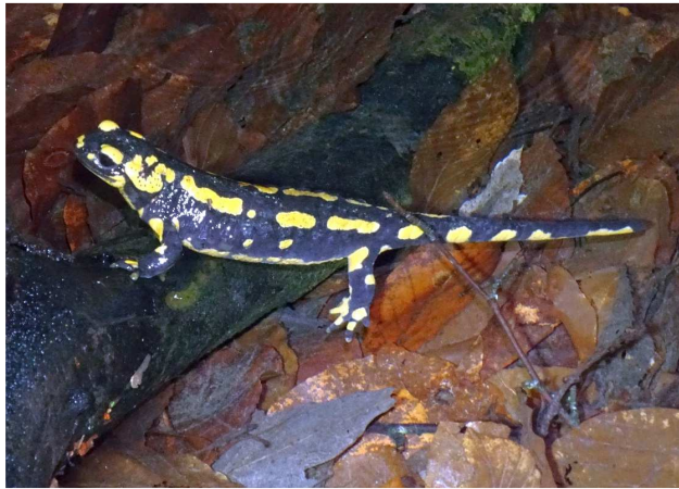
Abb. 5: Weiblicher Feuersalamander an einem Nebengewässer des Höhenbaches, 10.03.2020

Es konnten keine Gartenteiche oder sonstigen Gewässer innerhalb des Gebietes festgestellt werden. Der Untere Mühlbach (Höhenbach), der die Westgrenze des Untersuchungsgebietes bildet, ist aber in seinem Oberlauf ein Reproduktionsgewässer für den besonders geschützten Feuersalamander ( Salamandra salamandra ), der hier im Frühjahr beim Absetzen seiner Larven beobachtet wurde (Abb. 5).