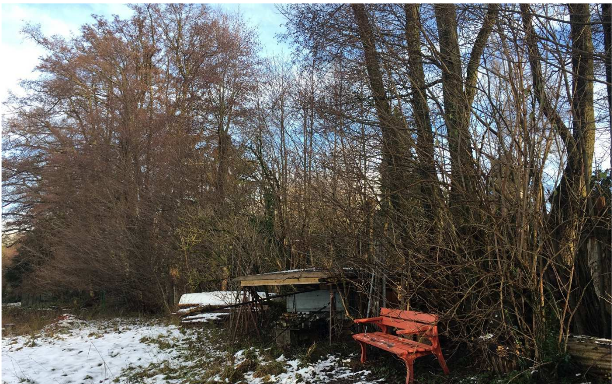
Abb. 10: Gewässerabschnitt vom Mühlwegaus, mit Lagerung von Holz, Anhänger, etc..