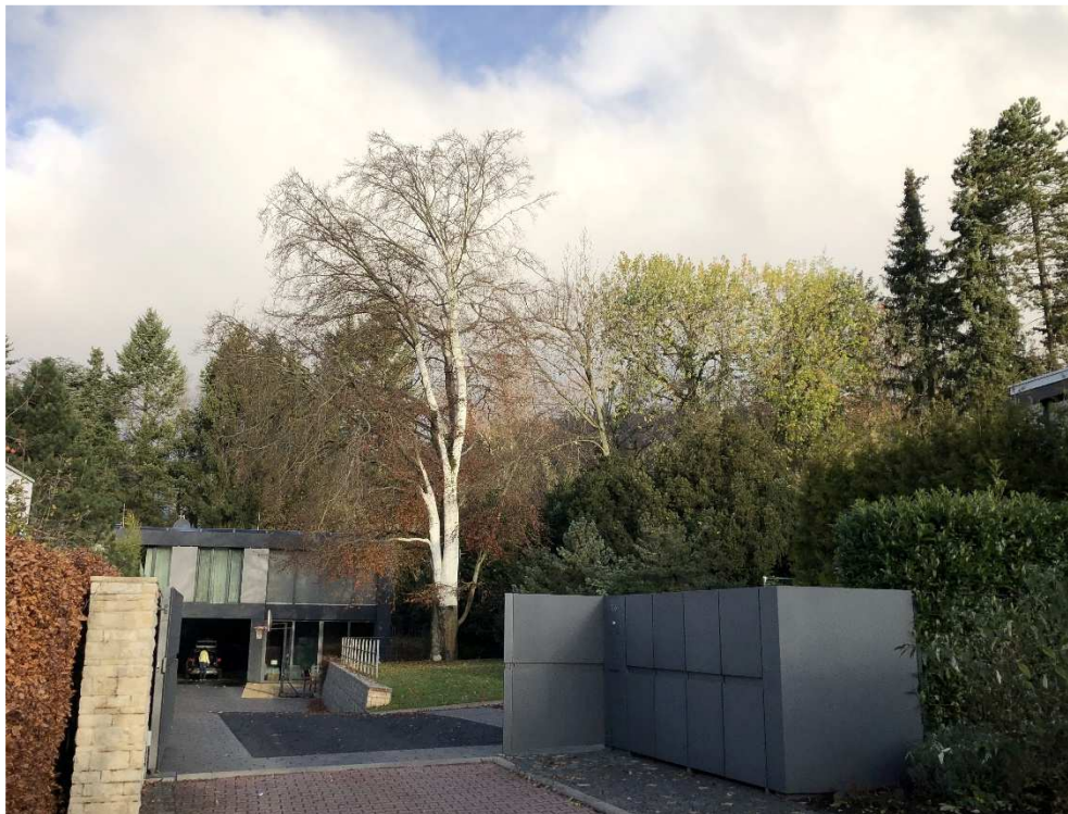
Abb. 3: Intensiv gepflegter Ziergarten im Reichenbachweg, 22.11.2021

Die einzelnen Gärten sind durch Zäune, Hecken oder Baumreihen aus Laub- und Nadelgehölzen voneinander getrennt. Neben den meist intensiv gepflegten Hausgärten mit häufig gemähten Rasenflächen und Ziergehölzen (siehe Abb. 3) gibt es auch große Gärten oder vereinzelt verbrachte Baulücken (Abb. 4).