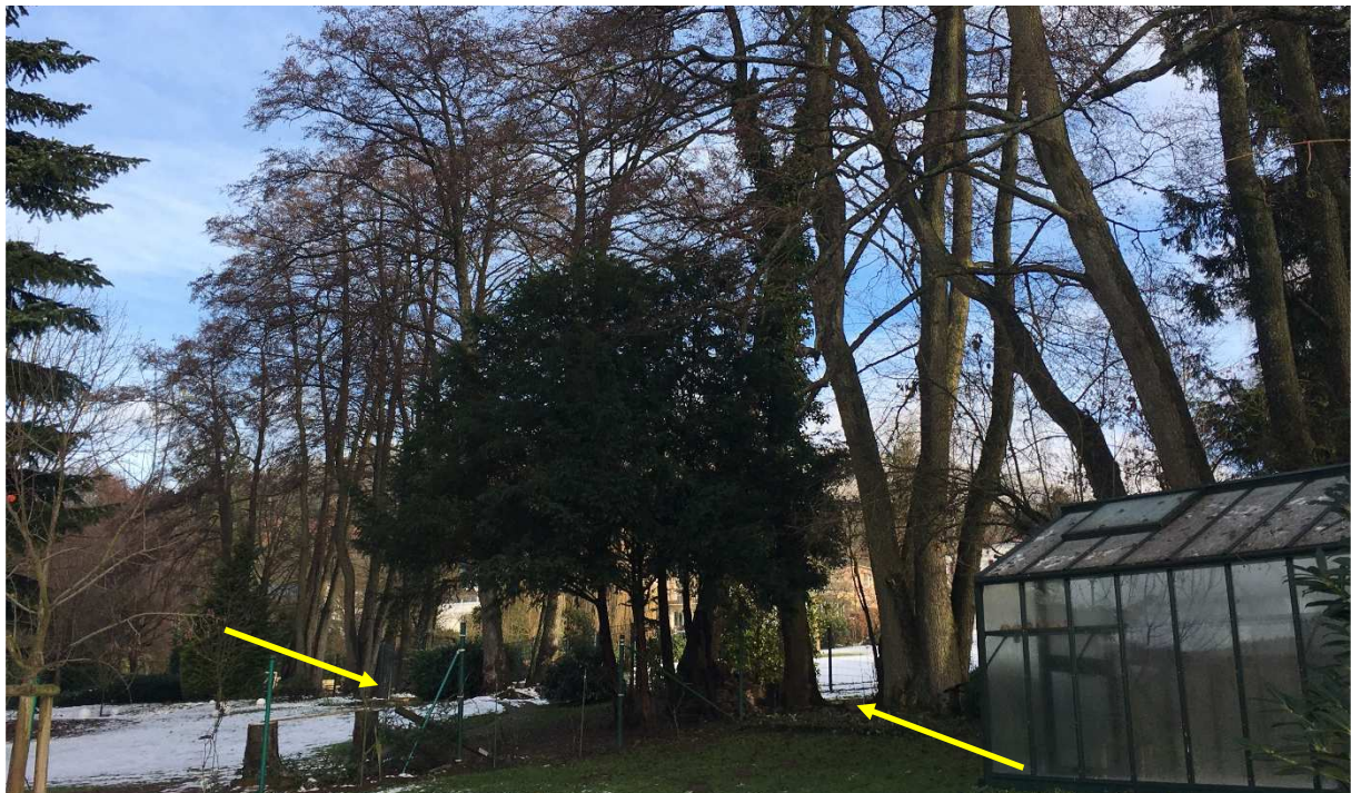
Abb. 6: Bachverlauf im südlichen Abschnitt mit randlichen intensiven Nutzungen.

Wie die nachfolgenden Abbildungen zeigen, weist der Bach im Abschnitt des Geltungsbereichs des Bebauungsplanes nahezu an keiner Stelle die wesentlichen natürlichen oder naturnahen Merkmale, wie z.B. Verlaufsform, Gefälle, Verzweigung oder Materialanlandung auf. Naturnahe Wasser-, krautige und holzige Ufervegetation fehlen, abgesehen von den bachbegleitenden alten Schwarzerlen nahezu vollständig; dies insbesondere aufgrund der Tatsache, dass seitens der angrenzenden Grundbesitzer offensichtlich schon lange Zeit die intensive Gartenpflege meist über das Gewässer hinaus durchgeführt wurde.