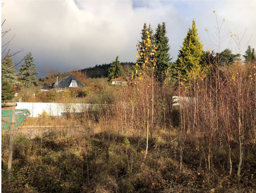
Abb. 4: Brachfläche mit Birkenaufwuchs „Am Ellerhang 5“, 23.11.2020

Außerdem wurden zwei schon länger geräumte Grundstücke „Am Ellerhang 5 und 7“ untersucht, auf denen nach Abriss der Gebäude Brachwiesen mit Hochstauden und eine Sukzession aus jungen Birken und sonstigen Sträuchern aufgewachsen ist (Abb. 4).