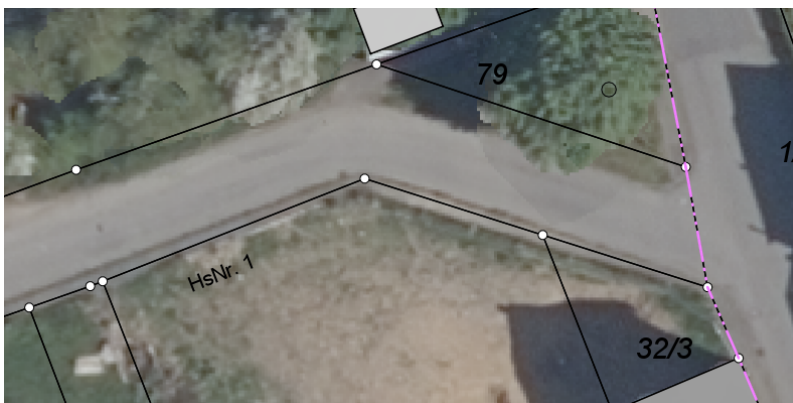
Luftbild aus dem Jahr 2021.

Durch die Beibehaltung der bisherigen Bordsteinkante ist es zu dieser erheblichen, gerade in dem Knick vorhandene punktuelle Gehwegreduzierung gekommen. Der Gehweg wurde demnach vor vielen Jahren dort auf Privatgrundstück errichtet. Um hier insgesamt eine neue Lösung für diesen Bereich erzielen zu können ist eine völlige Neuordnung der Straßenführung, verbunden mit einem grundhaften Ausbau in diesem Bereich vorzunehmen. Dies kann allerdings nicht zu Lasten des Grundstückseigentümers erfolgen, der lediglich sein Grundstück benutzt und bebaut hat.