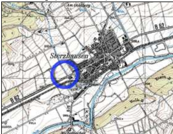
Räumliche Lage (unmaßstäblich)