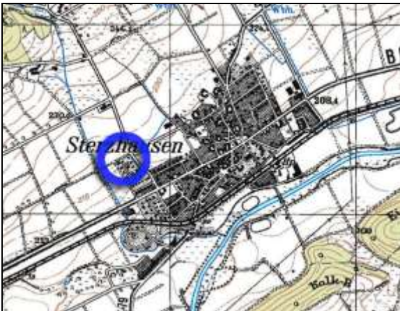
Räumliche Lage (TK25 – unmaßstäblich)