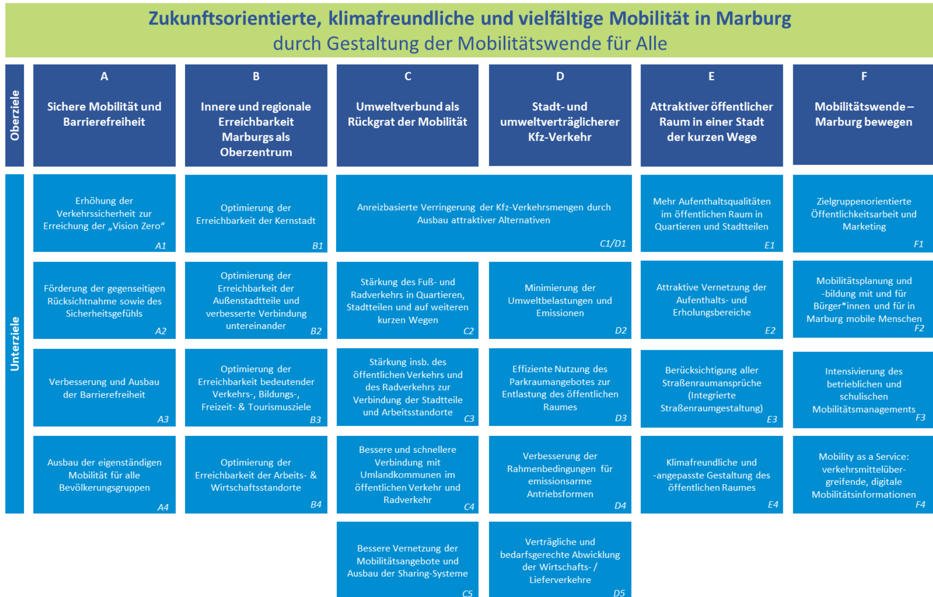
Abbildung 1: Zielsystem MoVe 35