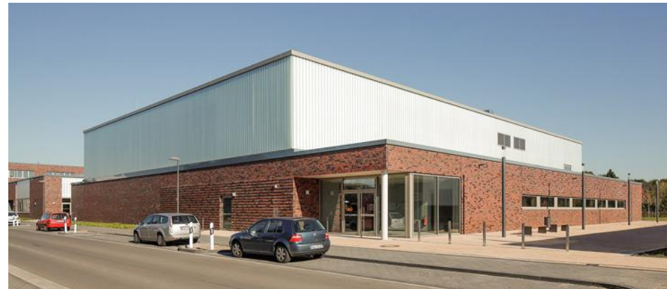
© Tchoban Voss Architekten, Dreifeldsporthalle Geldern