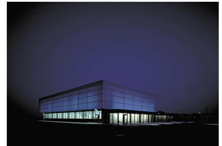
© wulf Architekten, Konrad-Adenauer-Sporthalle in Hamm