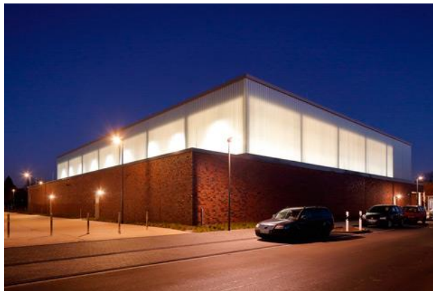
© Tchoban Voss Architekten, Dreifeldsporthalle Geldern