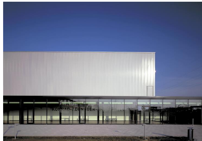
© wulf Architekten, Konrad-Adenauer-Sporthalle in Hamm