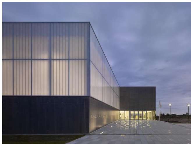
© Yohan Zerdoun, Martin Duplantier Architectes