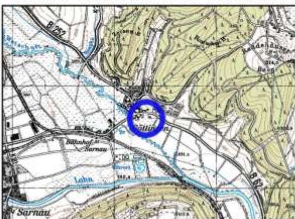
Räumliche Lage (Ausschnitt TK 25 - unmaßstäblich)