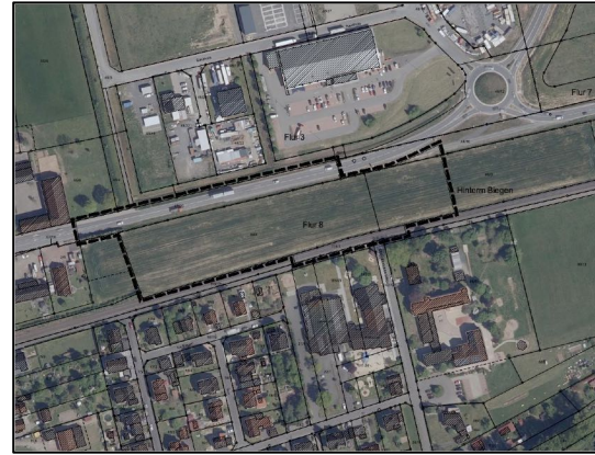
Abbildung 2: Plangebiet auf Luftbildbasis (HVBG)

Die beiden Sportstätten der Gemeinde Lahntal können die gesteigerten Bedarfe im Schul- und Vereinssport nicht mehr hinreichend abdecken und entsprechen auch nicht mehr den aktuellen Anforderungen an Sportstätten. Eine bauliche Sanierung und Erweiterung der Sporthallen scheidet aus - es soll daher an zentraler Stelle ein Ersatzneubau einer Multifunktionssporthalle mit einem erweiterten Angebot für sportliche und kulturelle Zwecke entstehen. Mit der neuen zentralen Halle soll erstmals auch ein Turnierbetrieb unter Beteiligung von Zuschauern möglich sein.